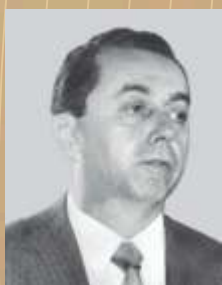
Humberto de Campos