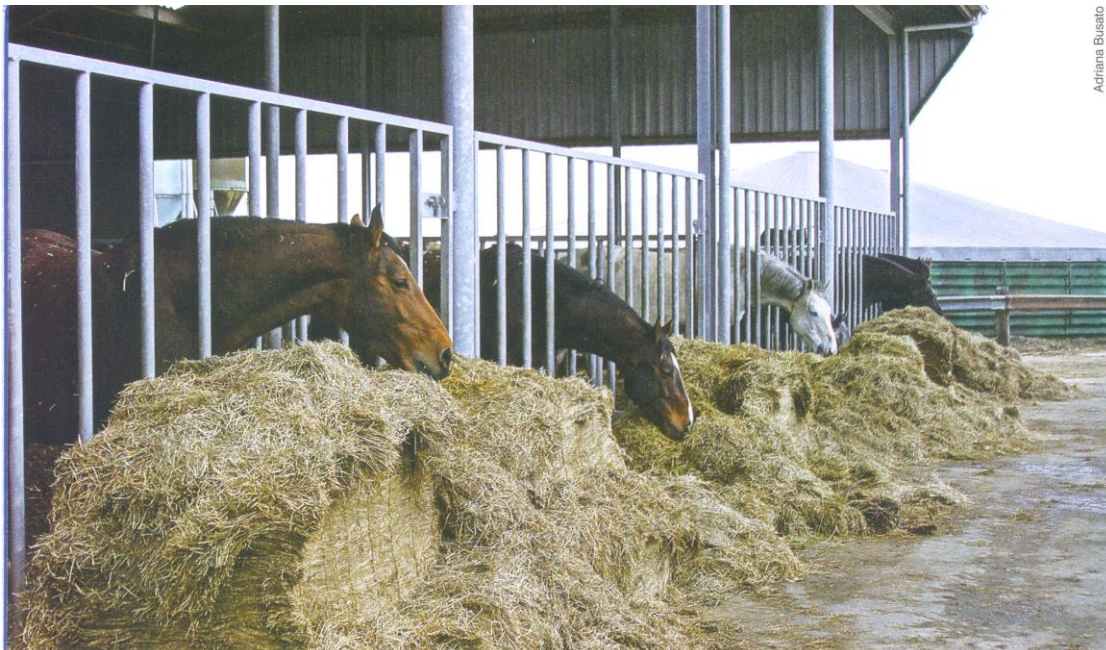
Sistema de criação intensivo