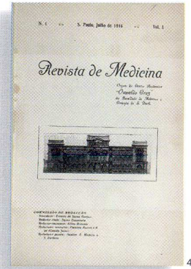
O número inicial da Revista de Medicina , surgida em 1916, 15 anos antes da inauguração da sede atual da FMUSP (ao lado)