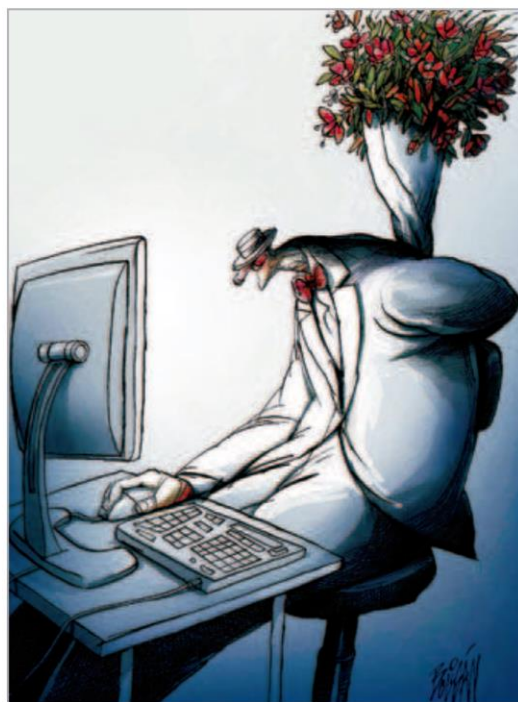
Exposição Boligan, maestro do humor, no Museu da Esalq, tem 50 desenhos