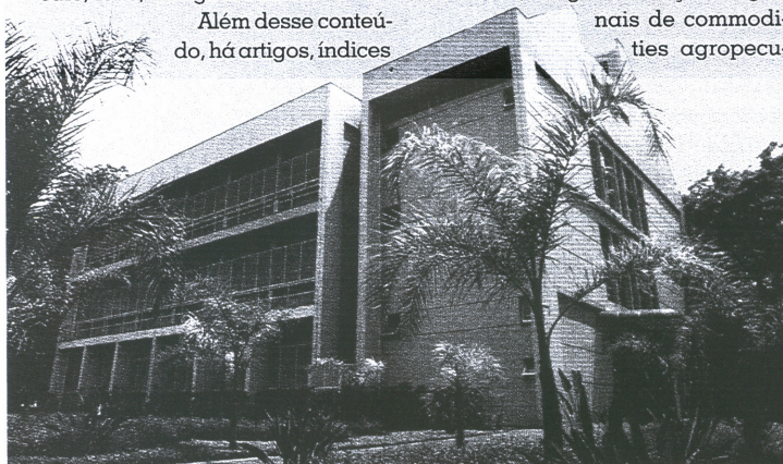
Prédio do Cepea: aumento de demanda por informações

A demanda por informação agropecuária do Brasil cresce na proporção em que o setor ganha espaço no mercado mundial. Atualmente, o país é o maior produtor de carne bovina, de suco de laranja, de café, de açúcar e álcool; o segundo maior de soja (basicamente soja não-transgênica), de frango e de mandioca – citados apenas alguns produtos do portfólio de pesquisa do Cepea.