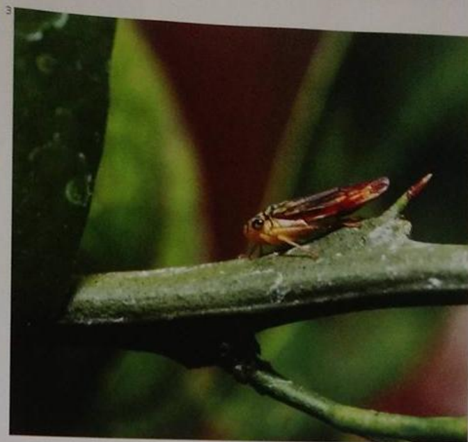
Transmitida pela cigarrinha (acima), a Xylella impede o transporte de água e nutrientes pela planta, gerando frutos duros, pequenos e queimados (ao lado)

taminação de viveiros pela bactéria e na queda da incidência do problema nos laranjais paulistas.