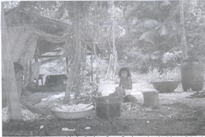
Ribeirinhos da comunidade Caxiuanã, no Pará: modos de vida tradicionais

Peixe – Naquelas localidades, foram aplicados questionários a respeito das condições básicas de vida e geração de renda, hábitos alimentares, tipos de roça e formas de uso dos recursos naturais de subsistência (autoconsumo). Além disso, foram coletadas unhas e algumas amostras de alimentos para análise isotópica, o que permitiu traçar a origem e o perfil da alimentação local, se era proveniente de itens produzidos ou extraídos localmente ou na cidade, com mais carne de caça, peixe – de água doce ou marinha –, e se era rica em produtos naturais, entre outros. “Durante a convivência nessas áreas isola-