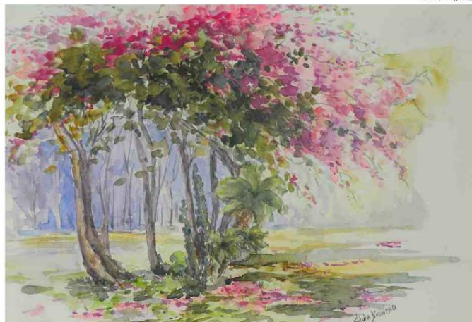
Sílvia Dionísio ganhou medalha de prata (acadêmico) por Florada na Estação