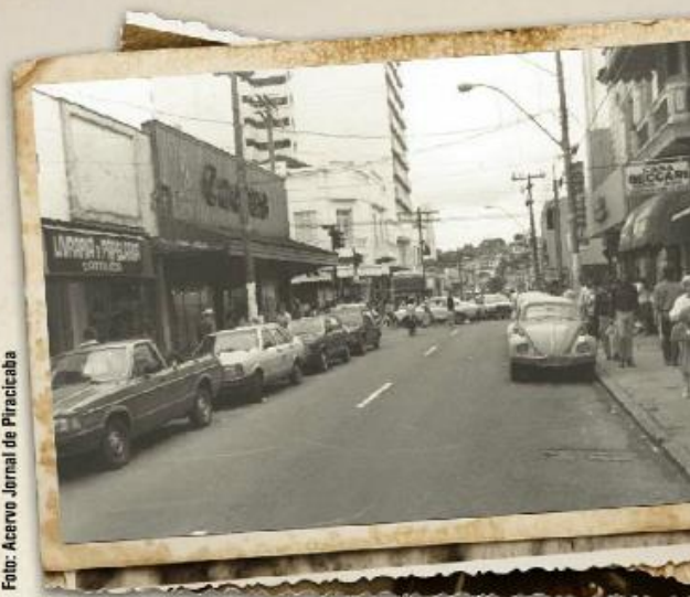
Cruzamento da rua XV de Novembro com a Governador nos anos 80