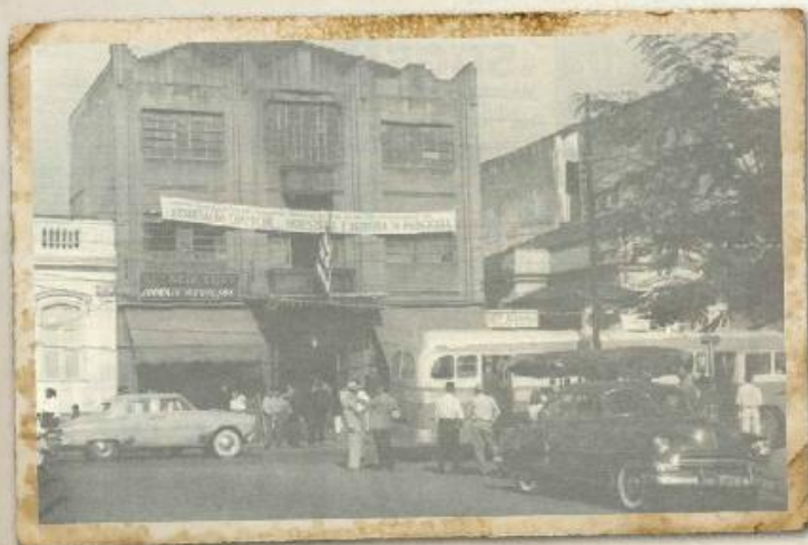
Sede da ACIPI na rua XV de Novembro no ano de 1958