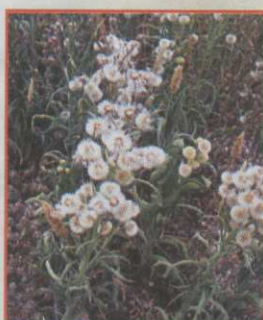
Sementes de coniza: transporte pelo vento.