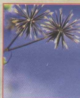
O picão usa as fezes do gado como veículo.