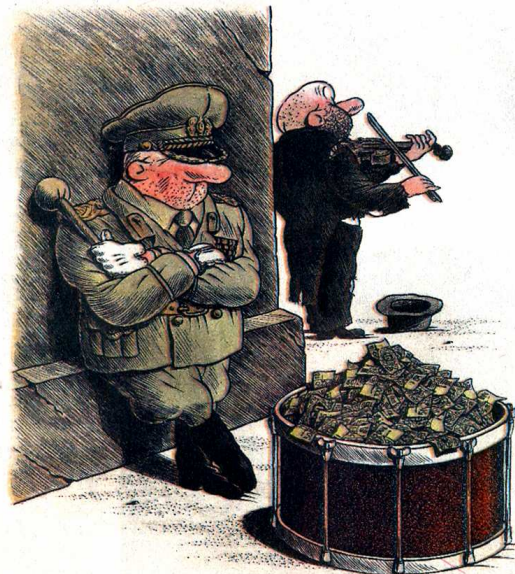
Cartum de 1991 de Jurij Kosobukin, da Ucrânia

de agosto, de segunda a sexta-feira, das 8h às 11h30 e das 13h30 às 17h. Informações (19) 3429-4305 ou (19) 3429-4410.