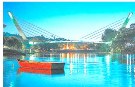
Passarela para a Cultura é o título da foto de Nelson Campos