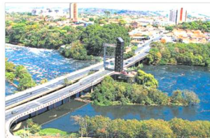
Ponte Estaiada em foto aérea de Manuella Galhardo Domenico

margem do rio na Rua do Porto e do Aquário Municipal.