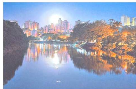
retrata o rio e a cidade sob a luz da lua