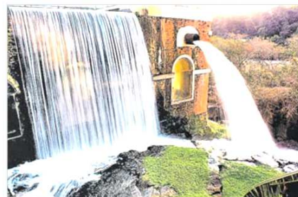
Museu da Água de autoria de Jéssica Fernanda Vitti