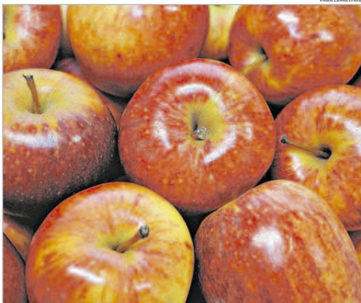
Flexitarianismo deve ser encarado como novo rótulo para uma alimentação mais balanceada, com muitas frutas

As razões que levam à prática do flexitarianismo podem surgir por motivações ecológicas, econômicas ou voltadas à saúde. O que muitas vezes causa um impacto negativo a essa tendência é a postura do flexitariano que, com o novo hábito, busca principalmente seu próprio benefício, expondo algumas vezes o discurso que a vontade humana está em primeiro lugar, o