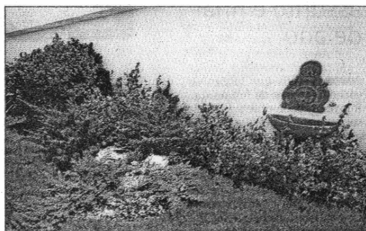
A influência da atrativa arquitetura do Mediterrâneo tem sido notada há muitos anos no nosso país. Um jardim com o toque do Mediterrâneo tem um charme especial