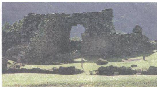
Projeto prevê a construção de torre de observação com passarelas no sítio arqueológico

Imprensa Oficial – Conteúdo Editorial Assessoria de Imprensa do Jornal da USP