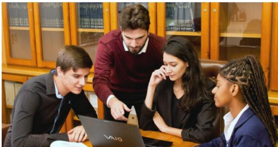
Alunos do curso de Administração da Esalq