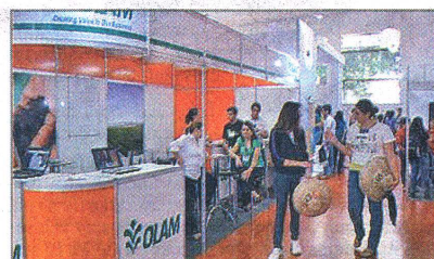
Evento do ano passado reuniu empresas e estudantes