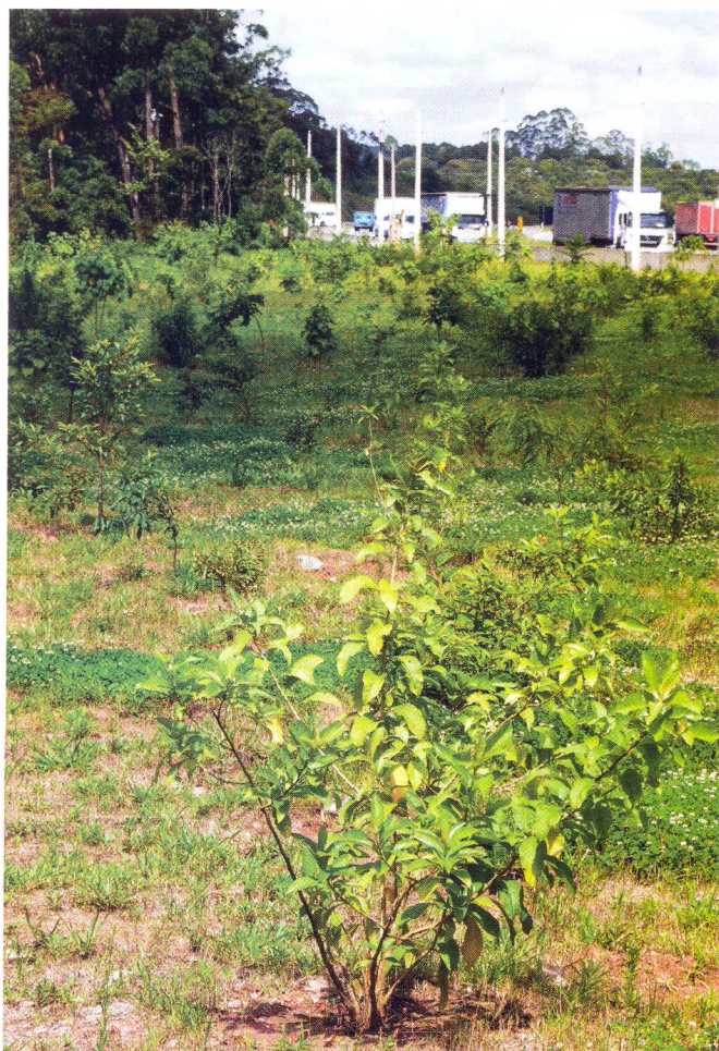
Por um fio: as árvores custam a crescer em solo pobre, como na área ao lado, um ex-depósito de entulho, e morrem após geadas fortes como a de Cotia em julho de 2011 (abaixo)

A legislação fez os viveiros de mudas ampliarem o número de espécies e a produção de mudas de árvores nativas. Barbosa, outra vez, foi atrás dos números e verificou que 55 viveiros cadastrados produziam 13 milhões de mudas de 277 espécies nativas em 2001. Seu levantamento indica que hoje 208 viveiros produzem 41 milhões de mudas de mais de 600 espécies nativas do estado de São Paulo (o site do instituto, www.ibot.sp.gov.br , remete aos viveiros cadastrados e à lista das 700 espécies de árvores já reconhecidas como nativas do estado). Com esse avanço,