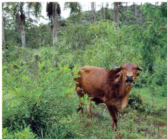
Bloqueios: placas e cercas tentam impedir o avanço de moradores insatisfeitos e bois famintos

ele acredita que a tarefa de reflorestar os 1,3 milhão de hectares do estado devem agora levar 63 anos, não mais 200, como há 10 anos.