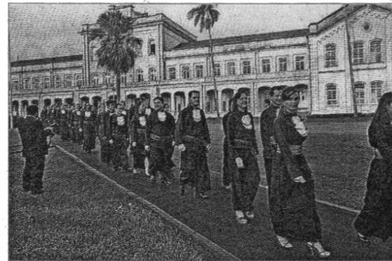
Entrada de formandos teve tapete vermelho no gramado