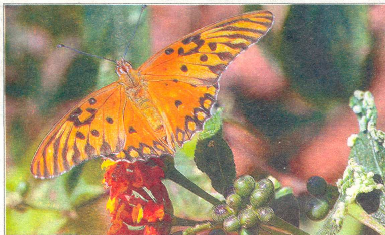
As borboletas foram pesquisadas por cientistas da Esalq e são o tema de exposição

dores, a exposição mostrará algumas espécies que existem no Brasil, com informações sobre os estágios de desenvolvimento até atingir a fase adulta, como também, sobre as plantas que são hospedeiras das lagartas.