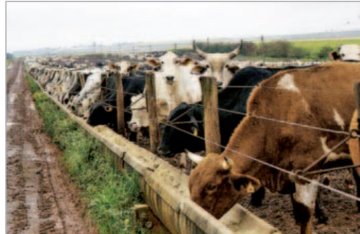
Neste ano, cerca de 4 mil animais devem passar pelo confinamento

mápolis e Mombuca. "Em 2014, o projeto mobilizou 3.500 alunos de 4ª e 5ª séries que acompanharam experiências práticas sobre sustentabilidade, incluindo o processo de recolhimento e destinação de embalagens vazias de agrotóxicos. O projeto é aberto ainda para estudantes de cursos técnicos e do ensino superior.