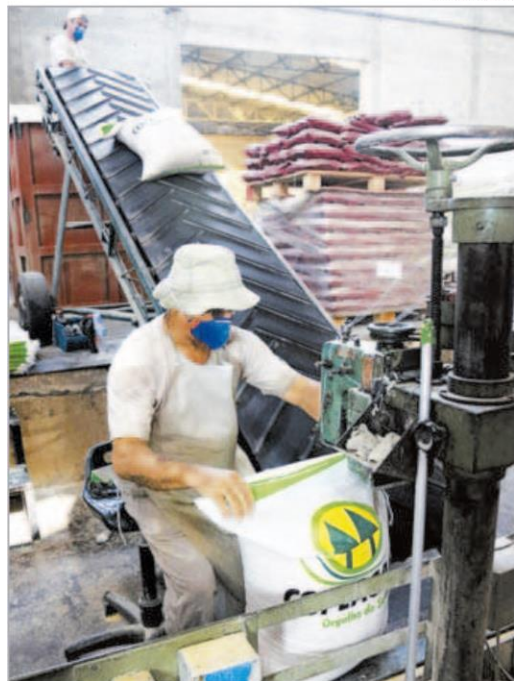
Até o final de 2016, a nova fábrica de ração deve estar operando