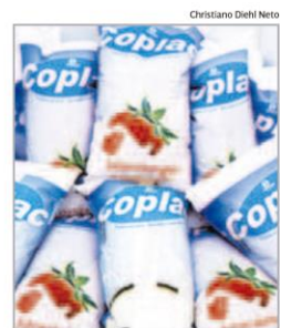
Iogurtes sabores de morango e coco já estão sendo comercializados

Produto será comercializado em padarias e mercados nos sabores morango e coco