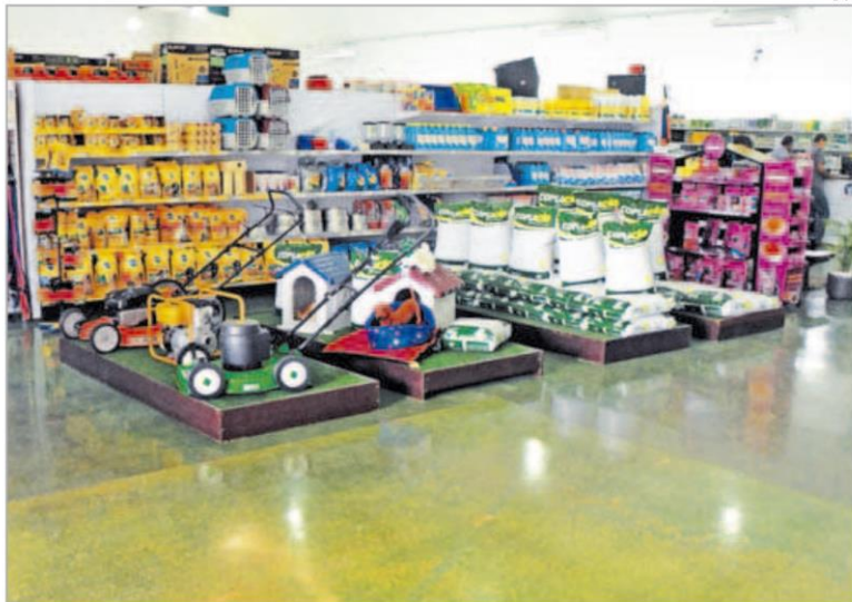
Dentre as atribuições da Coplacana está a oferta de mais de 12 mil itens utilizados na agricultura

Dentre as atribuições da Coplacana está a oferta de mais de 12 mil itens utilizados na agricultura, como adubos e corretivos de solos, agroquímicos, implementos agrícolas, peças e acessórios para máquinas e implementos, linha veterinária completa, ração, linha de farelos e concentrados para alimentação animal. Tem ainda sementes das melhores qualidades, equipamentos