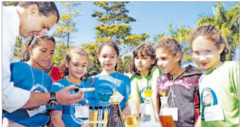
Durante as atividades do Dia Nacional do Campo Limpo, a Coplacana recebe cerca de 3.500 crianças

Um dos principais serviços oferecidos pela Coplacana aos seus cooperados é o confinamento de gado de corte, em sistema boitel (baseado no modelo de produção cooperativista, reconhecido