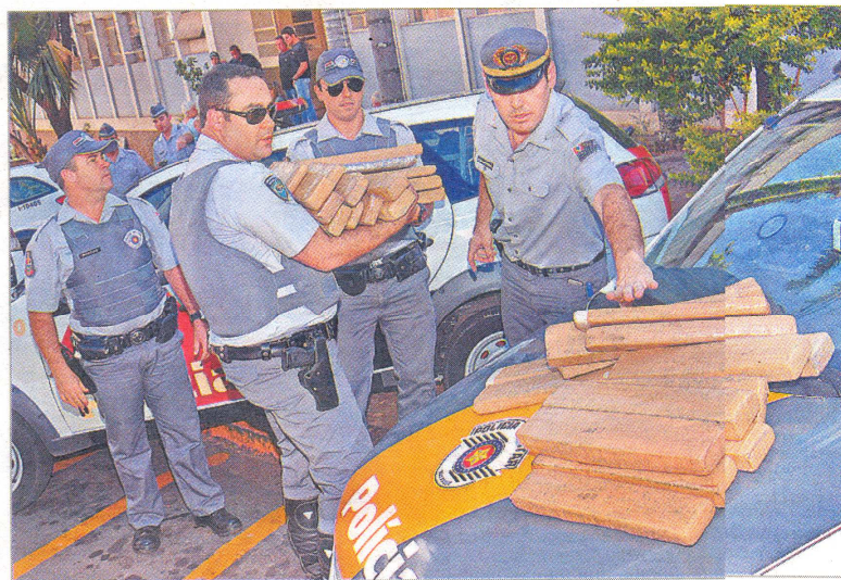
Parte da droga foi apreendida por policiais rodoviários e o restante por homens das 1ª e 4ª Companhias

"Temos de tirar o chapéu para os PM's porque eles prenderam os caras sem atirar, nem ferir ninguém", disse um dos