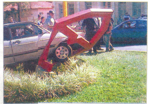
Motorista só parou ao bater no "A Encarnado" que fica na Esalq