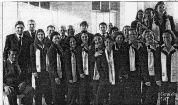
Coral da CAT