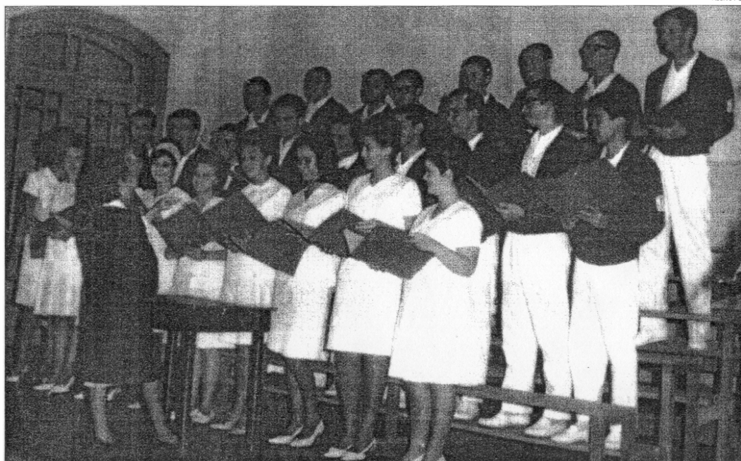
Coral da FOP, em 1964