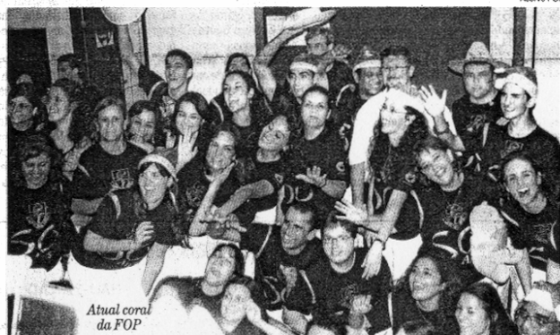
Atual coral da FOP

Como diz o ditado popular, conhecendo música ou não, pessoas que fizeram ou ainda fazem parte de corais afirmam ter suas vidas transformadas depois de decidirem soltar a voz e a emoção por meio da música.