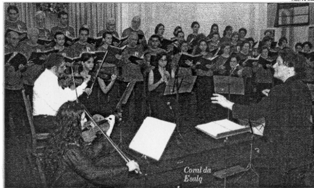
Coral da Esalg