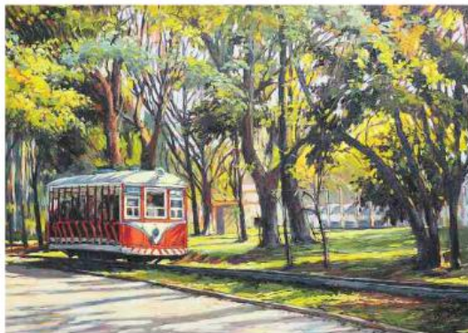
Obra Lembrança do Passado integra a exposição