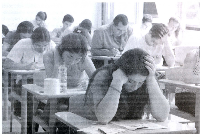
Candidatos a uma vaga no ensino superior: dados refletem iniciativas da USP voltadas para a inclusão social

de Preparação para o Vestibular da USP, que tem como objetivo principal o de oferecer reforço escolar para os alunos da rede pública. O público-alvo são os alunos da rede pública que, tendo prestado o vestibular da Fuvest, foram bem classificados, mas não conseguiram ingressar na Universidade. As aulas do programa tiveram início em agosto, com 691 alunos matriculados, dos quais 202 são alunos PPI, que recebem uma bolsa de manutenção no valor de R$ 300,00 mensais.