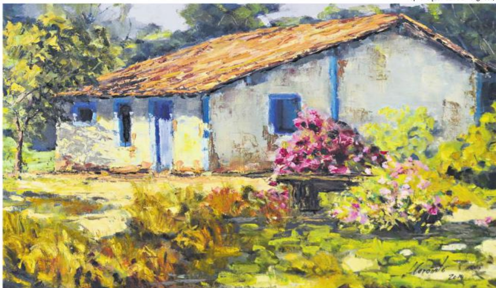
Obras com técnicas e estilos diversos estão expostas na Escola Bauhaus até 14 de junho