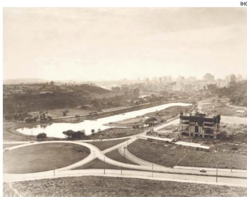
Memorial da Acipi expõe totens com fotos antigas e atuais