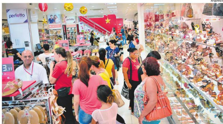
Para pesquisadores que elaboraram o estudo, comércio desaquecido é reflexo da crise

Segundo a Acipi, mesmo negativa, a leve variação pode indicar um pequeno freio na desconfiança dos varejistas com relação ao setor. Apesar do recuo de 12,58% na confiança dos empresários com relação à atividade comercial atualmente, mensurada pelo ICA (Índice de Confiança