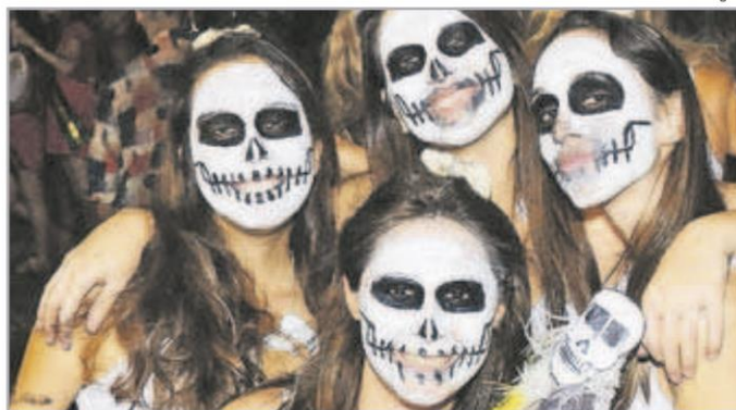
Elas foram para a comemoração da libertação de caras pintadas