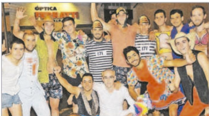
Os estudantes comemoraram a "alforria" e estão livres dos trotes