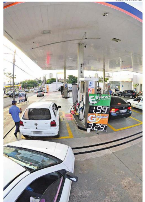
Nessa faixa de preço, etanol é mais vantajoso que gasolina

Entre 9 e 13 de maio, o Indicador Cepea/Esalq do etanol hidratado foi de R$ 1,3746 por li-