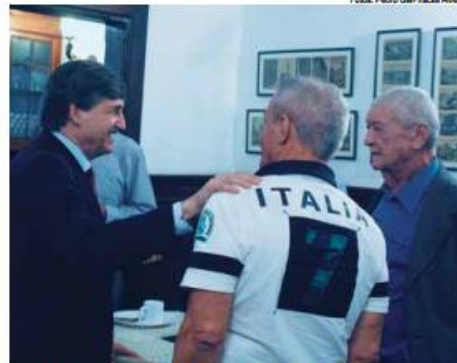
Senador conversou com representantes das famílias italianas de São Pedro