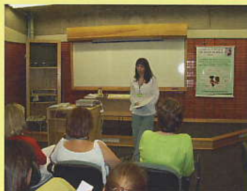
Aula: "Motorista do Destino" (Programa de Educação)