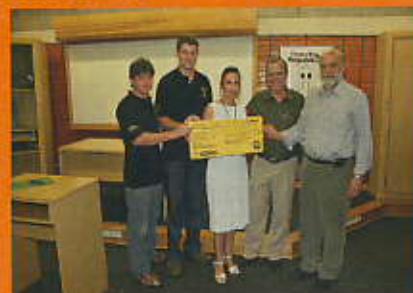
Alunos representantes do Conselho de Repúblicas

A DIBD recebeu do Conselho de Repúblicas da ESALQ o valor de R$ 15.000,00 para a aquisição de novos livros.