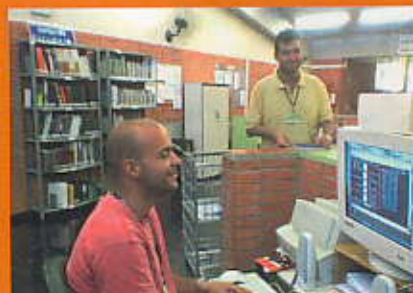
Alunos como estagiários na biblioteca

A participação dos alunos na biblioteca já faz parte do seu cotidiano e é extremamente gratificante o apoio, o convívio e o compartilhamento do conhecimento.