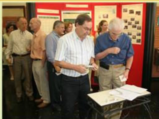
Participação de docentes