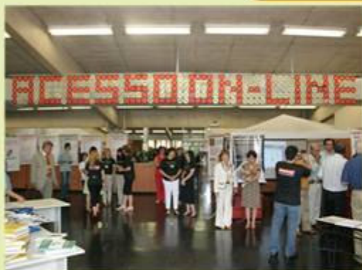
Destaque: tema da Semana