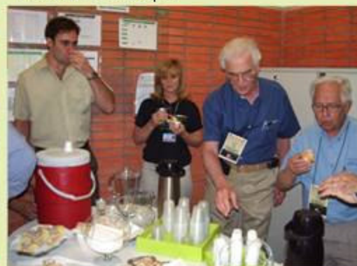
Coquetel de inauguração da Semana