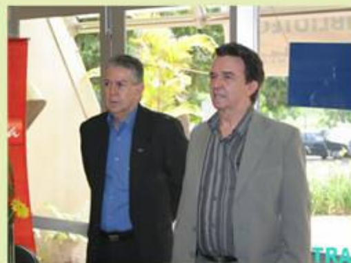
Representantes do SIMESPI