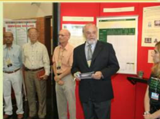
Presença do Diretor da ESALQ e do Prefeito do Campus