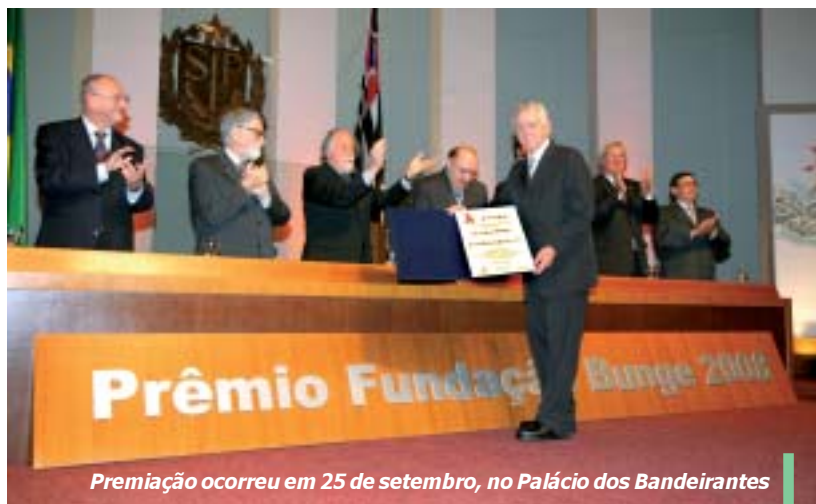
Premiação ocorreu em 25 de setembro, no Palácio dos Bandeirantes