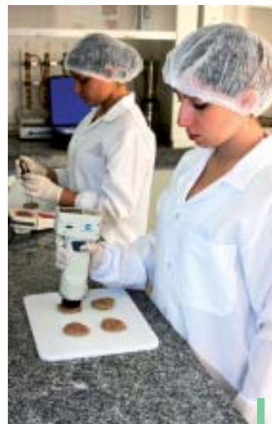
Alunos realizam testes com alimentos no Laboratório de Processamento de Carnes