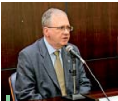
Zago falou sobre o financiamento das pesquisas no Brasil

ocupa apenas a 27ª posição quando nos referimos à participação dos produtos de alto tecnologia. Sobre investimentos, Zago lembrou que apenas 0,9% do PIB é revertido em políticas de C&T e que não basta ao Brasil liderar os gastos com P&D na América Latina, termos um bom índice de publicações, se não conseguimos transferir em conhecimento para o setor produtivo. A USP lidera o ranking de investimentos do CNPq. Em 2006 foram repassados para pesquisadores da instituição R$ 115 milhões. Em 2007, este montante chegou aos R$ 133 milhões. Na visita a Piracicaba, Marco Antonio Zago esteve acompanhado de José Oswaldo Siqueira, diretor de Programas Temáticos e Setoriais do CNPq. Na parte da manhã, Zago fez uma visita ao Centro de Energia Nuclear na Agricultura (CENA), onde participou das comemorações de 42 anos da instituição.