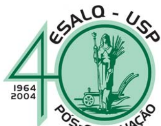
Logomarca dos 40 anos da Pós-graduação

Abrindo as comemorações dos 40 anos da Pós-graduação na ESALQ, o doutor Jorge Almeida Guimarães, presidente da Capes, proferiu aula inaugural, no dia 22 de março. Na ocasião, o palestrante fez questão de ressaltar o pioneirismo da ESALQ na produção de conhecimento, lembrando que a pesquisa brasileira tem a mesma idade dos estudos aqui iniciados.