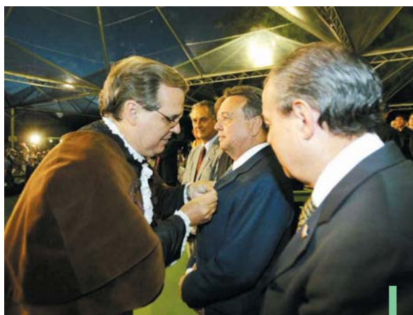
Presidência da República