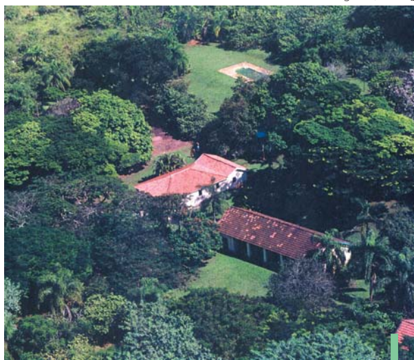
Vista Aérea do Centro Ecológico Flora Guimarães Guidotti

Diagnósticos do local estão sendo realizados, visando a separação da área agrícola da floresta existente. Posteriormente, serão