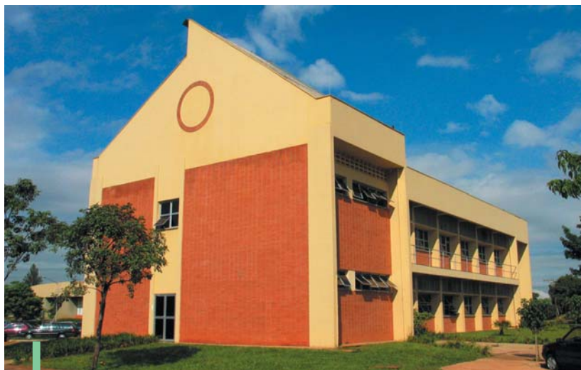
Prédio da Pós-graduação

Segundo Guimarães, a pós-graduação é uma das poucas áreas de que o país pode se orgu-