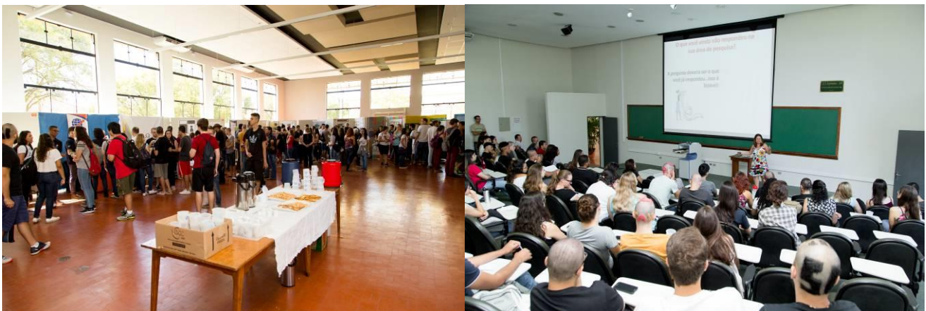
Figura 2. Fotos da Feira de Extensão e dos Depoimentos Acadêmicos.