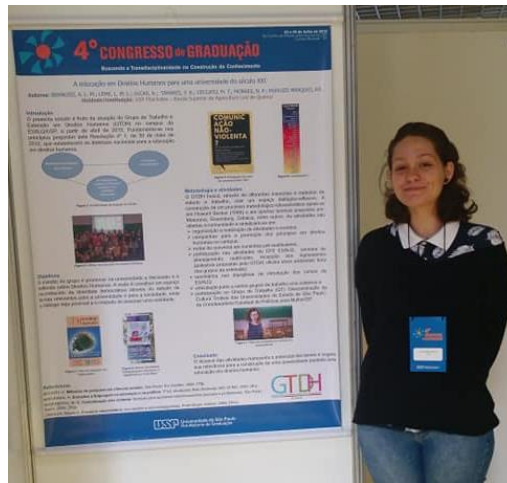
Figura 5 – Apresentação no congresso da Graduação USP