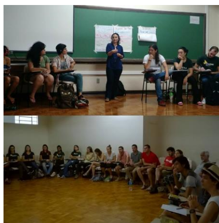
Figura 2 - I Roda de conversa sobre CNV