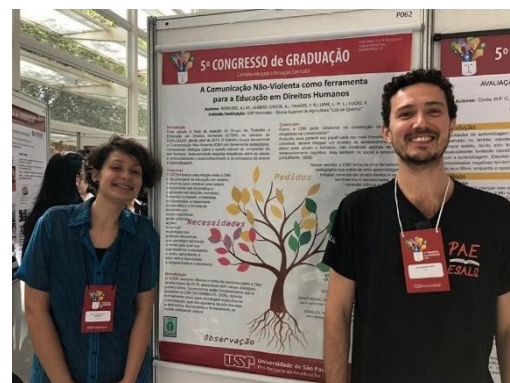
Figura 4. Participação do GTDH/ESALQ no 5º Congresso de Graduação.