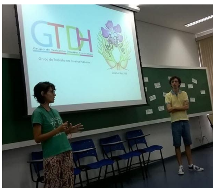
Figura 3. Vivência Socioambiental, realizada durante a Semana de Recepção 2019.