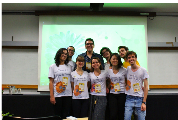
Figura 5. Participantes da organização da III Semana de Saúde Mental.