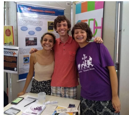
Figura 2. Participação do GTDH/ESALQ na Feira de Extensão.