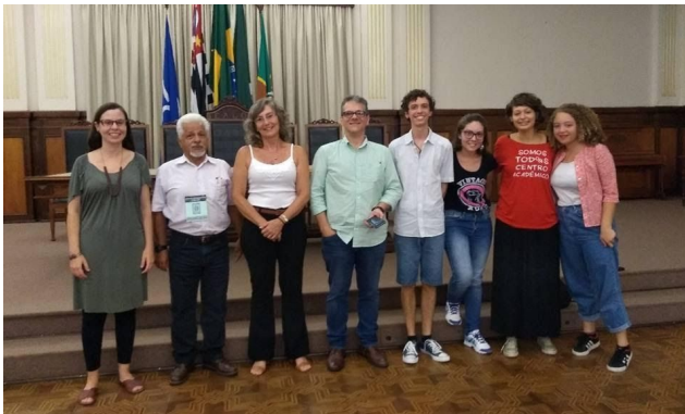
Figura 1. Palestra “Interações na USP: Qual é a realidade do nosso ambiente universitário?”