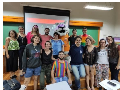
Figura 6. Participantes da organização da Semana da Diversidade ESALQ 2019