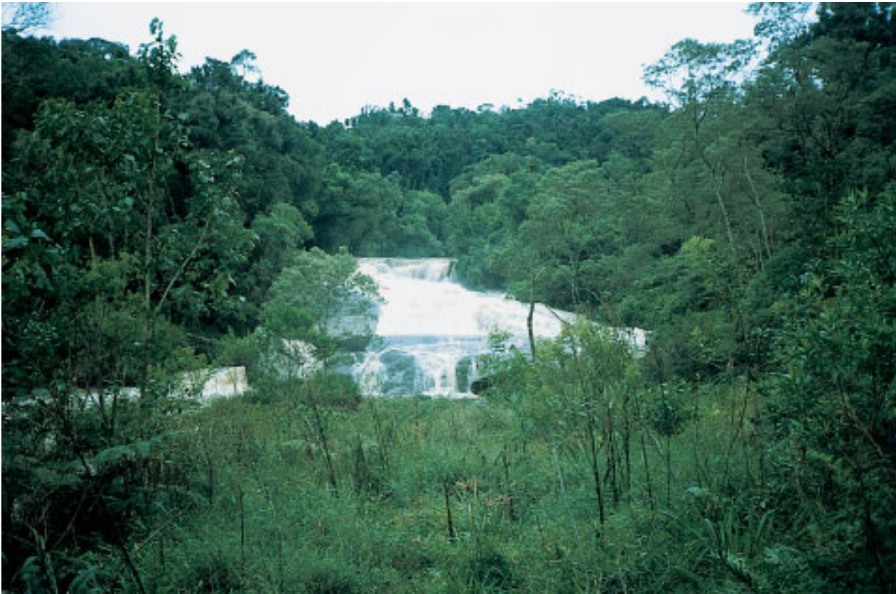
Rio de grande porte beneficiado por proteção florestal; Foz do Iguaçu, PR

conjunto dos fatores bióticos que envolve a mata ciliar e interações com a fauna e abióticos, representados pelas áreas saturadas das cabeceiras de drenagem e das margens dos riachos. A integridade do ecossistema ripário é um dos fatores-chave de resiliência da microbacia, ou seja, de sua capacidade de sofrer alterações sem perder a funcionalidade hidrológica. Ao perder a resiliência, o sistema se torna mais vulnerável a perturbações que, de outra forma, poderiam ser absorvidas sem mudanças em funções, padrões e controles naturais. No caso da degradação dos recursos hídricos, tão evidente em muitas regiões de nosso país, não há dúvida de que um dos fatores responsáveis por esse processo é a perda gradativa da resiliência em incontáveis microbacias, ocasionadas principalmente pela destruição do ecossistema ripário.