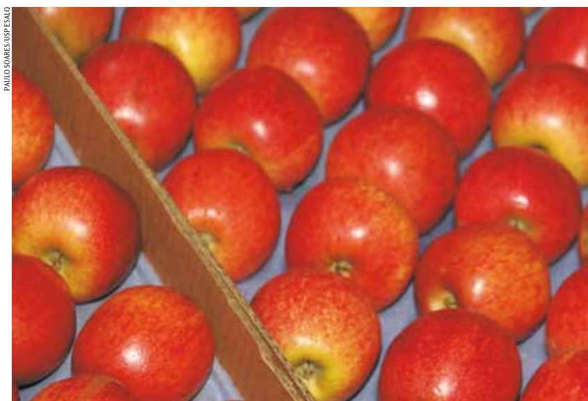
Maça: prevenir contaminação é melhor que adotar ações corretivas