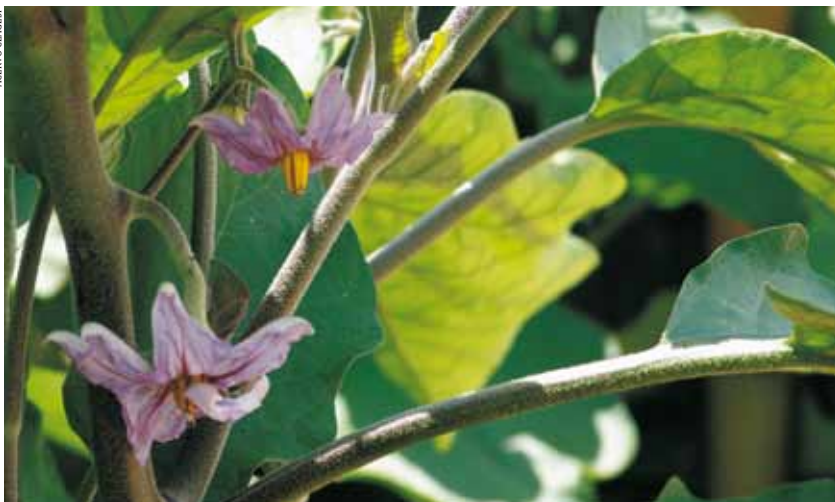
Flor de berinjela: produção integrada preconiza a preservação do meio ambiente

Eurep-GAP, Natures Choice, APPCC, ISO 14001, ISO 22000 e AS 8000 são algumas das normas ou protocolos requeridos por alguns mercados com esse objetivo para a importação de alimentos, incluindo itens como rastreabilidade, responsabilidade social e preservação do meio ambiente. Além disso, o potencial de atentados terroristas envolvendo agentes biológicos levou o governo dos Estados Unidos a estabelecer a Lei de Segurança da Saúde Pública, Prevenção e Resposta contra o Bioterrorismo (Bioterrorism Act), em 12 de junho de 2002. O Brasil, que ocupa a posição de terceiro maior produtor mundial de frutas, exportando cerca de 1% da produção nacional, precisa de políticas públicas e da adequação das cadeias produtivas, de modo a fortalecer sua competitividade, com produtos de alta qualidade e segurança.