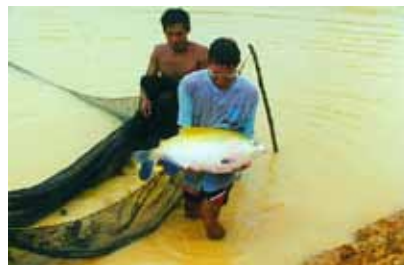
FIGURA 2 | DESPESCA EM VIVEIRO DE TAMBACUI, NO QUAL HÁ GRANDE CONCENTRAÇÃO DE SÓLIDOS EM SUSPENSÃO; IQUITOS, PERU, 1999

Ao se adotarem as BPAs, deve-se escavar e retirar os sedimentos com uma pá ou mesmo com trator de terraplanagem. É necessário evitar o depósito de sedimentos fora dos viveiros, para fins de agricultura, porque eles não contêm tanta matéria orgânica, como os piscicultores frequentemente imaginam. Os sedimentos precisam ser recolocados nas áreas dos viveiros de onde foram erodidos. Aqueles que forem recolocados no interior dos viveiros devem ser