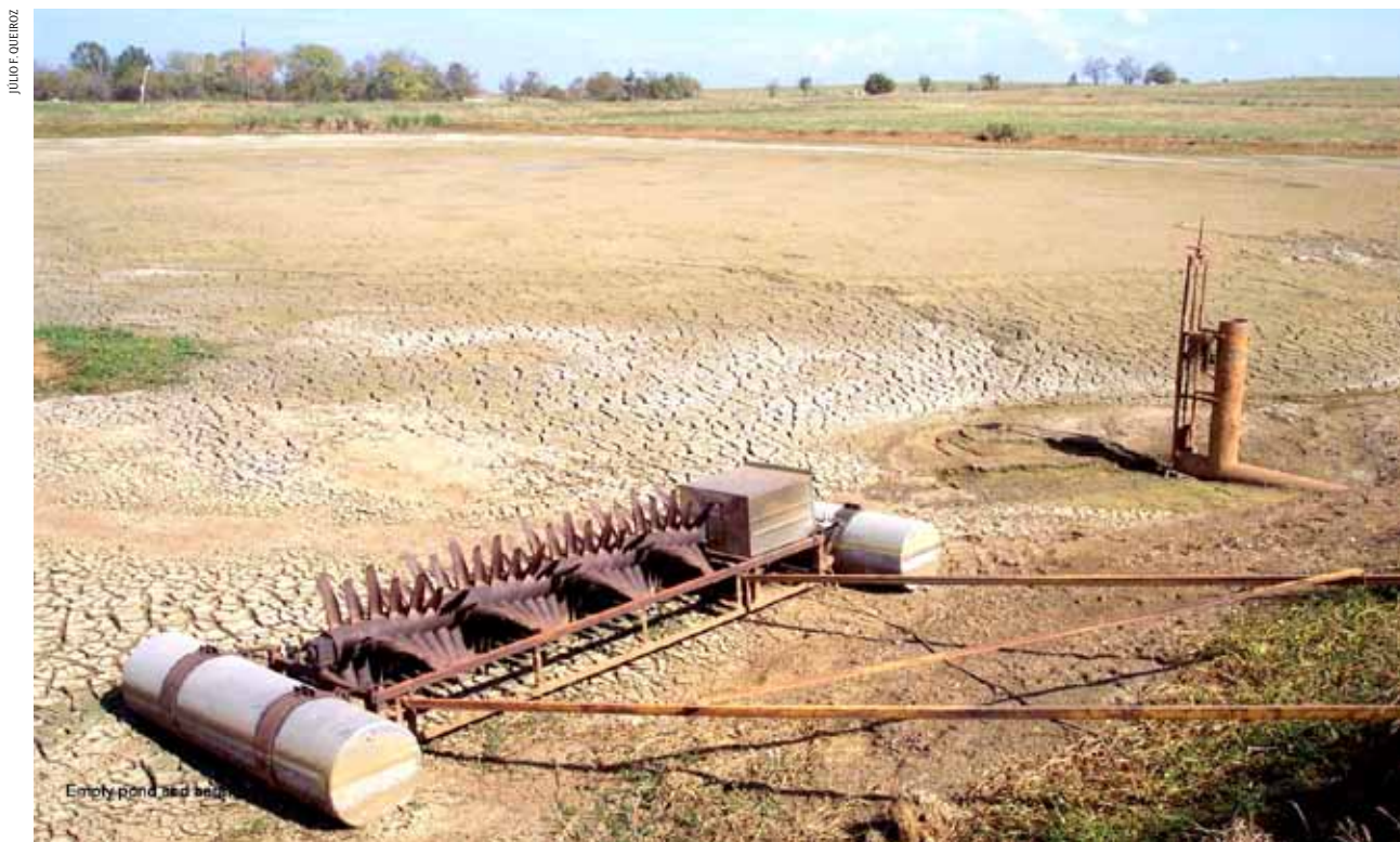
FIGURA 1 | FUNDO DE VIVEIRO DE PRODUÇÃO DE CATFISH, APÓS DUAS SEMANAS EXPOSTO AO SOL; ALABAMA, EUA, 2001

Deverá ser feita entre diferentes ciclos de cultivo para melhorar a aeração e a mineralização da matéria orgânica acumulada no fundo dos viveiros. O tempo necessário depende diretamente da textura dos sedimentos, da temperatura do ar, da intensidade do vento no local, de chuvas, infiltração da água ao redor dos viveiros e da água subterrânea no fundo destes (Figura 1). Pode perdurar por um período de duas a três semanas. Deve-se evitar a secagem por várias semanas, porque a taxa de decomposição da matéria orgânica irá aumentar até que o solo atinja seu conteúdo ótimo de umidade, e, a partir desse ponto, irá declinar se os sedimentos continuarem a secar.