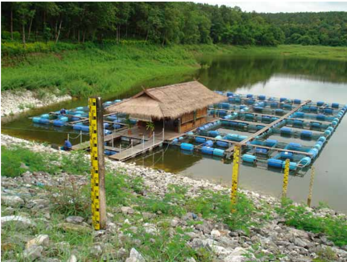
Piscicultura em tanques-redes; Rio Paraná; Santa Fé do Sul, SP, 2012

xa produtividade. O manejo adequado dos sedimentos pode contribuir para o aumento do oxigênio dissolvido, assim como para reduzir as concentrações de nutrientes, de matérias orgânicas e de sólidos em suspensão (Boyd; Queiroz, 2004). As boas práticas de produção aquícola serão abordadas, bem como seus procedimentos e características.