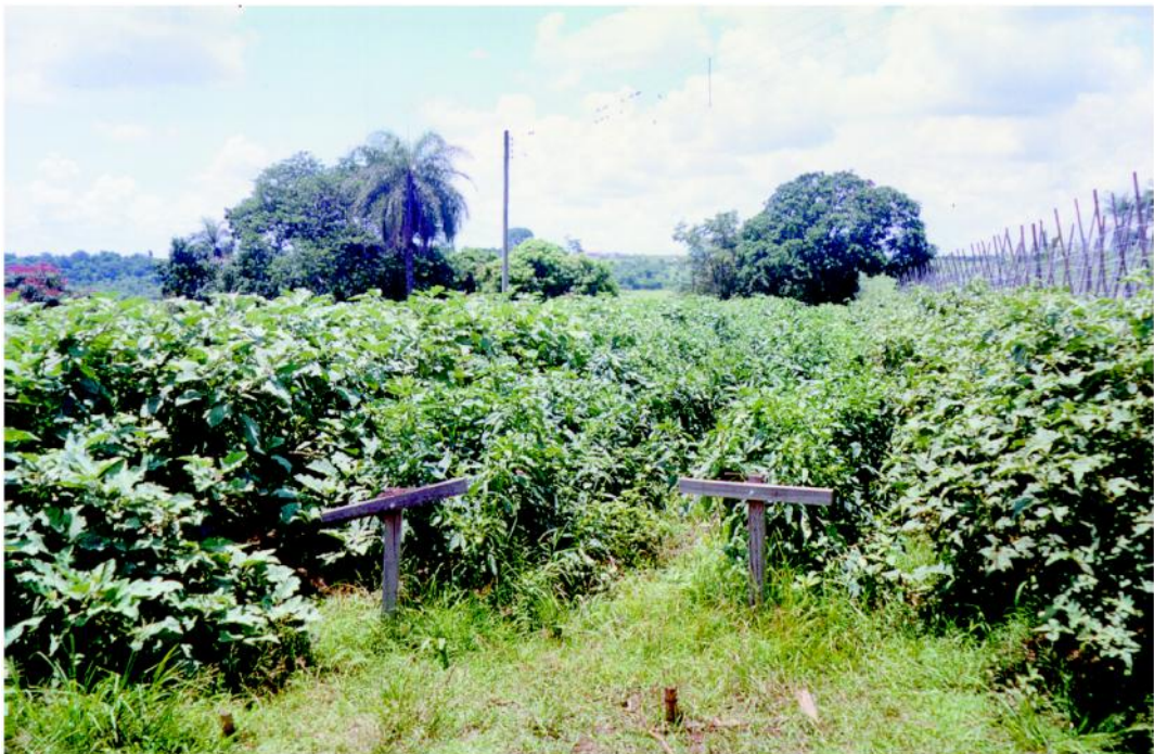
Figura 8 - Cultura da berinjela na qual é empregada a calda bordalesa para o controle de doenças fúngicas.

O controle de patógenos e insetos nocivos devem ser feitos por produtos que não agridam o homem e a natureza. Como não são utilizados os agrotóxicos na fruticultura orgânica, empregar os defensivos alternativos, nos períodos com potencial de ocorrer danos significativos. São muito empregados para o controle de moléstias a calda Bordalesa, calda Viçosa e a calda Sulfocálcica, entre muitos outros.