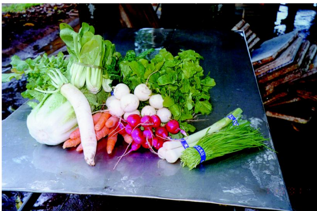
Figura 14 – Alimentos orgânicos apresentam alta qualidade superiores aos convencionais.