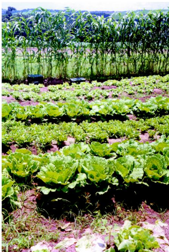
Figura 4 - Planejar área com hortaliças, com diversidade de espécies, linhas de cerca viva e quebra-ventos.

Estudo do mercado local e regional para verificar a possibilidade de colocação e preços que alcançam os produtos, e das condições climáticas (microclima da região), a disponibilidade de mão de obra e a assistência técnica