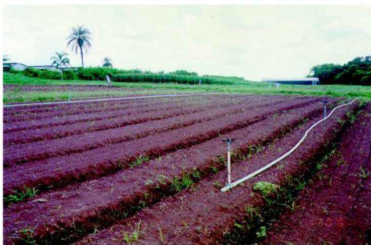
Figura 6 - Canteiros sendo preparados para o plantio orgânico.

Adotar o cultivo mínimo do solo, dando preferência ao preparo do solo com arado escarificador ou subsoladores. No caso de utilizar arado ou grades, fazer em seguida o plantio de