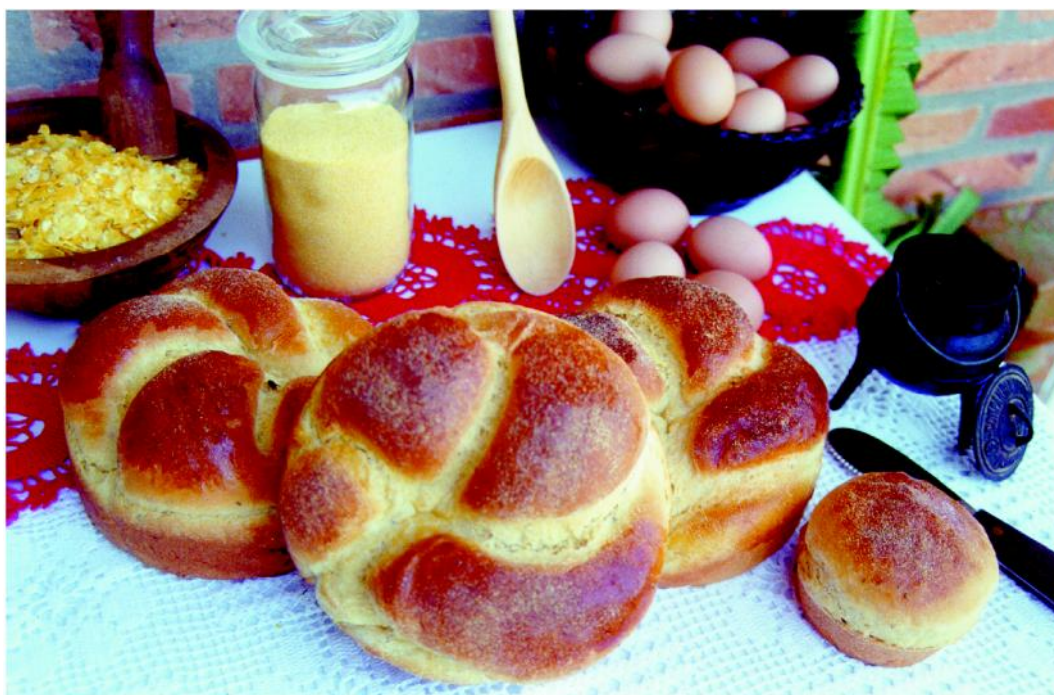
Figura 2 - Pães produzidos com grãos orgânicos. São mais saudáveis.

A seguir descrevemos os principais ramos da agricultura orgânica: