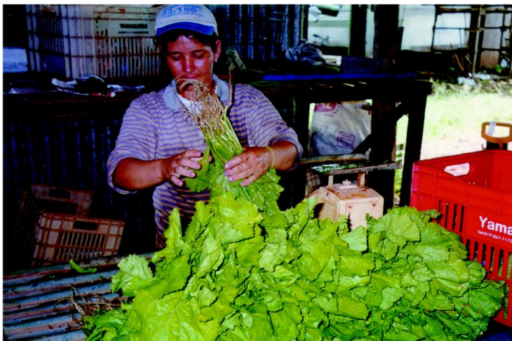
Figura 13 – Seleção e embalagem de hortícolas orgânicas.