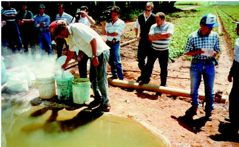
Figura 10 - Preparo da calda bordalesa no campo para controle de doenças.