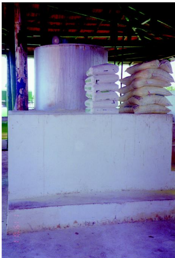
Figura 11 - Equipamento (caldeira) para a fabricação da calda sulfocálcica, utilizada no controle de insetos nocivos.

d) Preparo: a fabricação da calda é feito á quente, requerendo recipiente de metal (latão ou inox). No caso de preparar 100 litros, utilizar enxofre ventilado 25 kg+ cal virgem 12,5 kg.