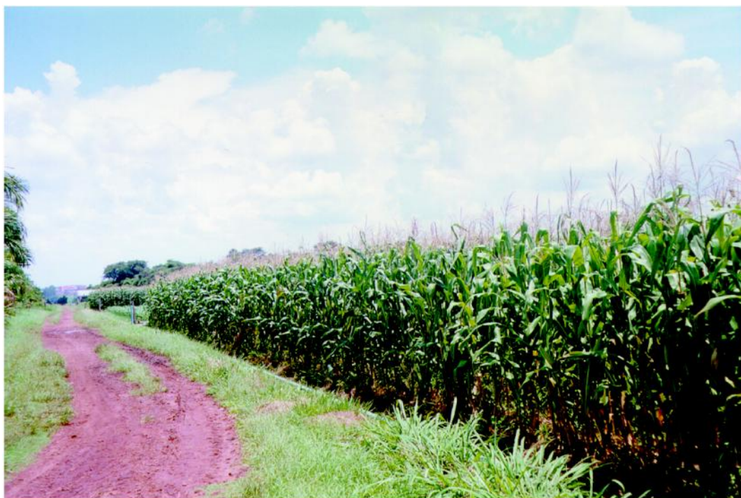
Figura 3 - Cultivo de milho orgânico apresenta excelente desenvolvimento e produtividade com respeito ao meio ambiente.

A agricultura orgânica trabalha com a tecnologia de produção ou seja no conjunto de procedimentos que envolvem a planta, o solo e as condições climáticas.