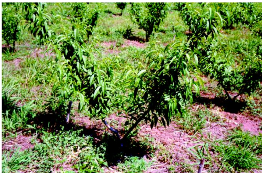
Figura 9 - Controle de ervas invasoras. Pomar de pêssego, tendo o solo mantido coberto com vegetação nativa roçada.

Em pequenas áreas como hortas e jardins pode ser empregado a erradicação manual das ervas indesejáveis. A capina pela enxada é uma prática comum, porém de alto custo nos dias atuais.