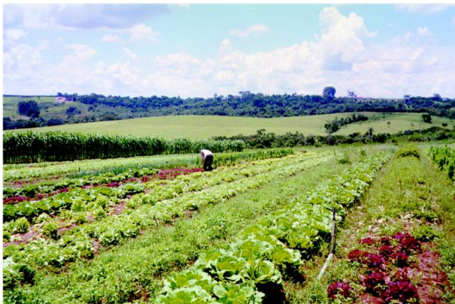
Figura 5 - Área com hortaliças orgânicas, observando a presença de ervas nativas que não afetam a produção.