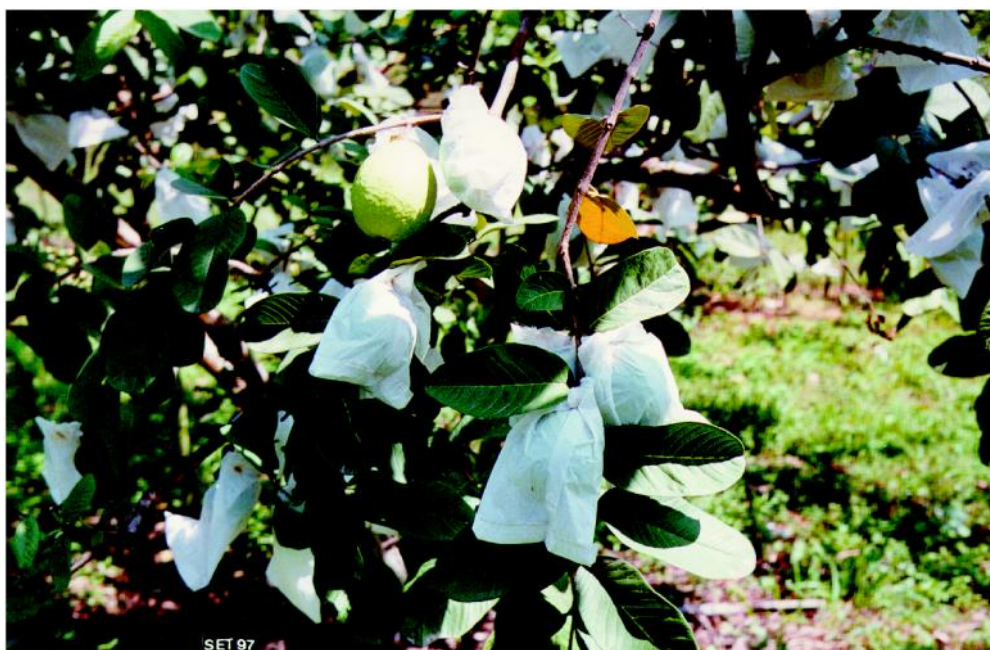
Figura 12 – Controle de pragas. O ensacamento dos frutos evita o emprego de agrotóxicos.

O ensacamento dos frutos com papel impermeável, tipo saco de pipoca, e com jornal, consistem em método simples e eficiente para evitar a ocorrência de larvas nos frutos, provocados por moscas de frutas e traças.