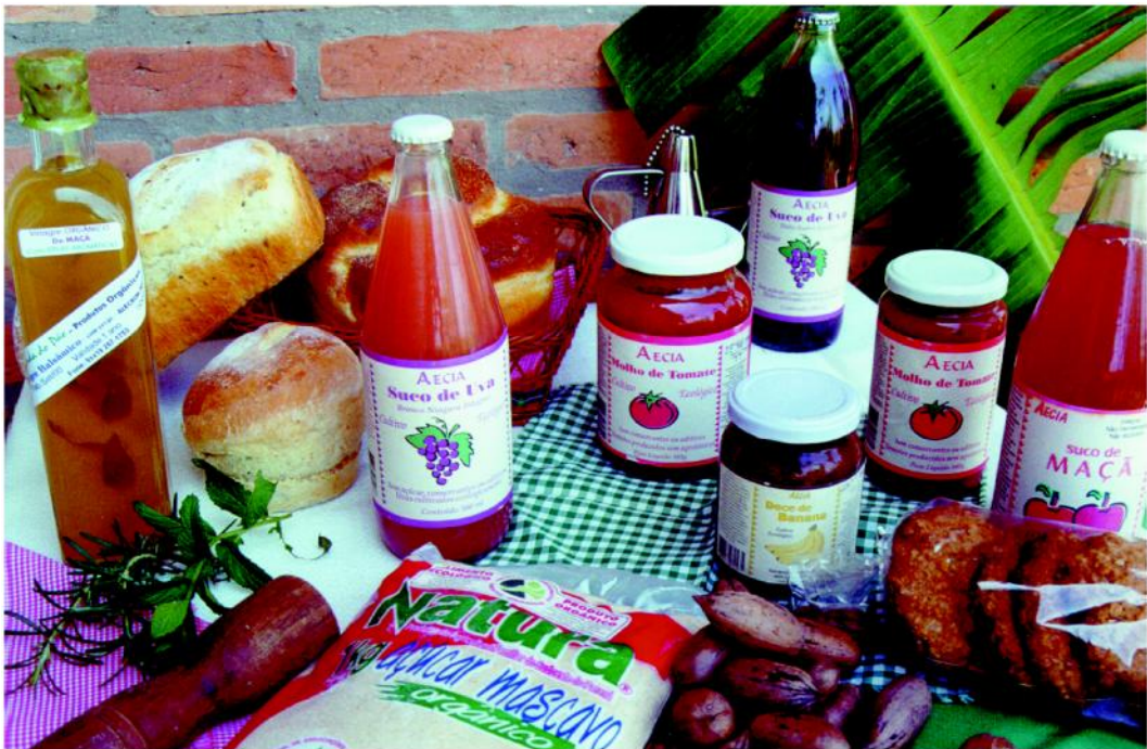
Figura 1 - Alimentos orgânicos. Hoje há grande variedade de produtos certificados no mercado.

Fazem parte da agricultura orgânica, diversos movimentos ou processos que adotam esses princípios básicos (agroecológicos), que são: agriculturas alternativa, biológica, orgânica, natural, biodinâmica, yamaguishiana, permacultura, agroflorestais, etc. No mundo todo, qualquer produtos obtidos através destes sistemas são conhecidos como alimentos orgânicos.