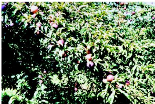
Figura 7 - Ameixeira da cultivar Carmesim, após a realização do raleio dos frutos.