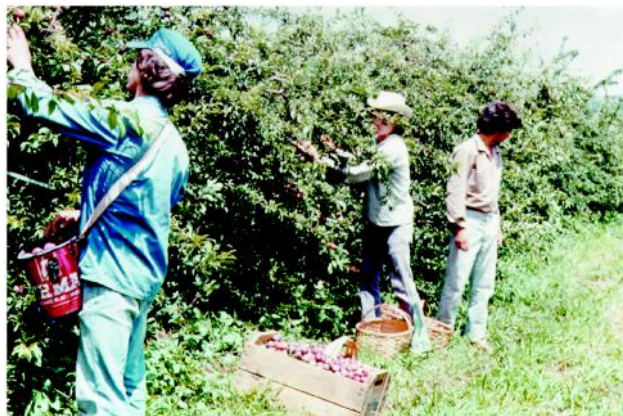
Figura 9 - Colheita dos frutos da ameixeira.