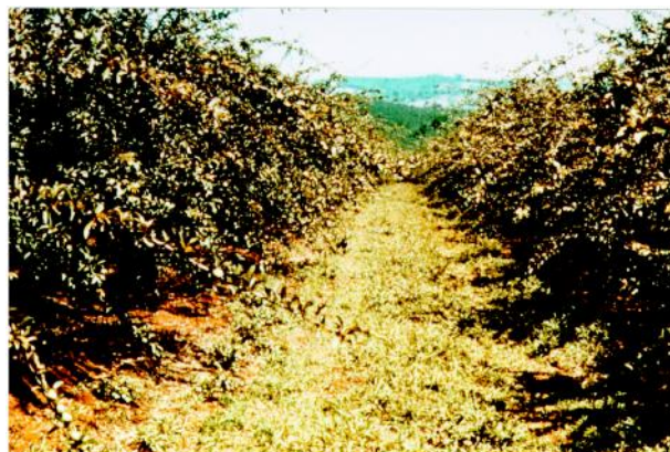
Figura 3 - Aspecto do pomar de ameixa. Nas ruas deve-se manter o solo com o mato manejado com a roçadeira.