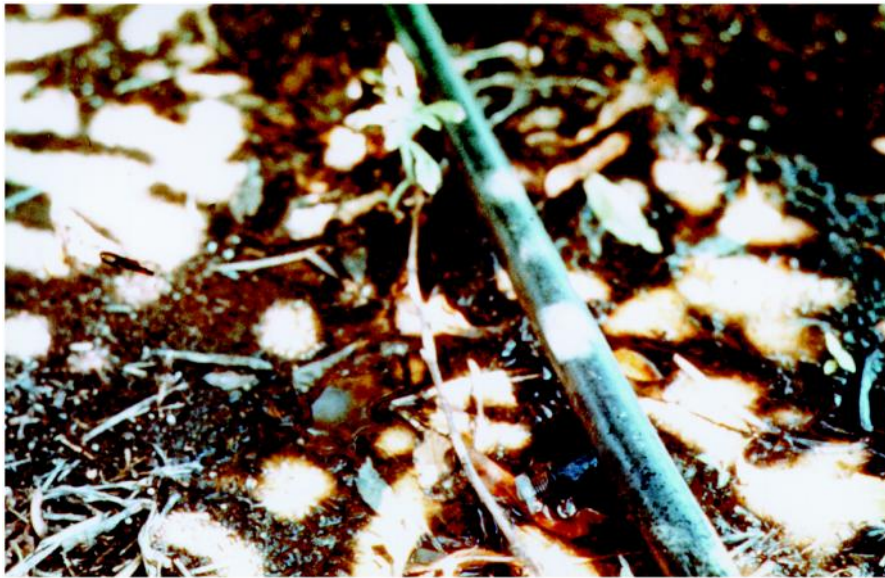
Figura 8 - O sistema de irrigação recomendado para a ameixeira é o localizado: microaspersão ou gotejamento.

A irrigação poderá ser feita em sulcos, bacias, aspersão, gotejo ou microaspersão, sendo preferível este último. Para substituição parcial da irrigação é conveniente fazer a cobertura morta da projeção da copa da planta.