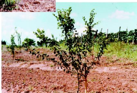
Figura 5 - Formação da planta no 1º ano. Mantém apenas 5 a 6 ramos básicos.