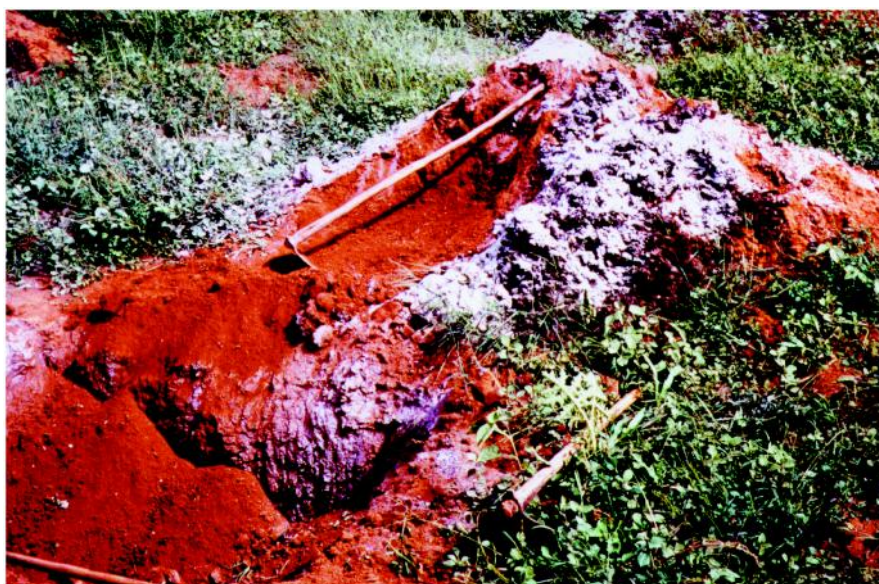
Figura 2 - Preparo da cova para o plantio da ameixeira.

A partir do início da brotação das mudas, aplicar em cobertura na parte exterior da projeção da copa, adubo compostado rico em nitrogênio.