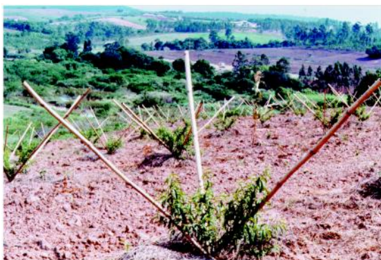
Figura 4 - Condução da muda da ameixeira. O uso de estacas facilita a condução aberta dos ramos.

Tem a finalidade de dar formato aberto aos ramos primários, facilitando maior copa e colheita. Após o plantio, faz-se a poda a 70 a 90 cm de altura, controlando as diversas desbrotas do enxerto, deixando desenvolver cinco a seis ramos primários, à partir de 50 cm de altura do solo. Os ramos devem ter livre crescimento, que no inverno seguinte sofram a poda de encurtamento e o amarrio para direcionar sua posição. Os ramos primários devem ser conduzidos inclinados, formando um ângulo de até 60 graus com o tronco, e suas pontas encurtadas para forçar a brotação. Anualmente reduz-se os ramos primários em 25 a 50%, dependendo do seu vigor, para provocar seu engrossamento.