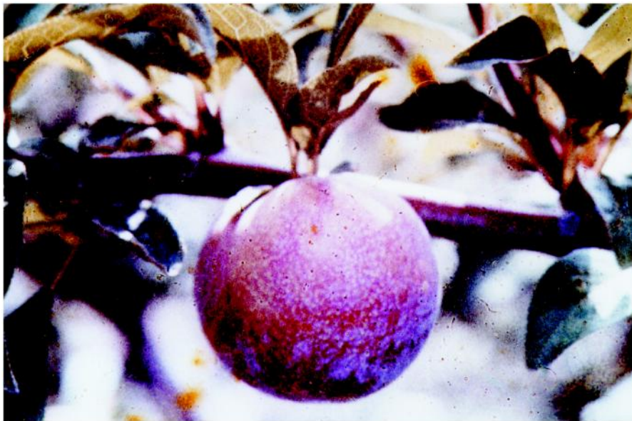
Figura 1 - Ameixa Carmesim.

Uma cultivar de introdução recente a Harry Pieckstone (polpa vermelha), tem tido bom comportamento nas regiões mais frias. As cultivares Irati e Rubimel I e Rubimel II (pêlcula vermelha) vem apresentando bom comportamento nas regiões de baixa quantidade de frio inverno do Estado de São Paulo, como Angatuba, Itapetininga, Vale do Paranapanema, etc. Apesar de não ser exigentes em polinização, no caso de ameixeiras, é recomendável o plantio de duas cultivares pertos, em faixas laterais, pois há o beneficiamento da polinização cruzada.