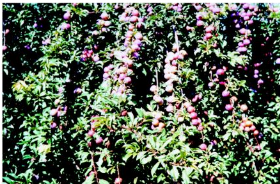
Figura 6 - Aspecto da frutificação da ameixeira antes do raleio dos frutos, com excesso na planta.

A ameixeira pode dispensar o desbaste da fruta, quando tal operação não oferecer retribuição no resultado econômico. No cultivo comercial deve-se fazer o raleio para proporcionar frutos graúdos, com maior valor comercial.