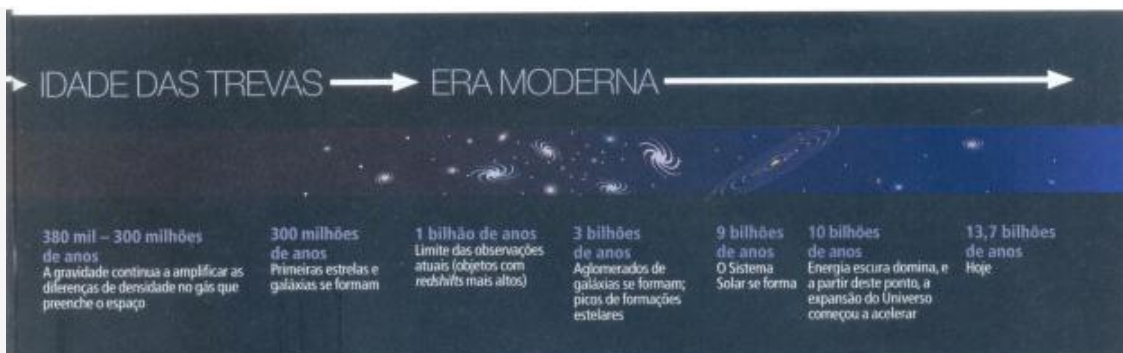
Fig. 3 - Evolução das estruturas do universo a partir do surgimento do átomo.