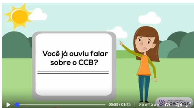
Figura 2. 1º Vídeo – Apresentação do Clube de Criação de Bezerros, o qual pode ser acessado em https://www.powtoon.com/ws/c77zuE59tTt/1/m

Em 2020, foi dada sequência a um projeto cujo o objetivo seria realizar visitas monitoradas no Bezerreiro Experimental “Evilásio de Camargo”, onde seria desenvolvidas atividades lúdicas baseadas nos programas 4-H, comum nas universidades americanas. Os valores 4-Hs (Head, Heart, Hands, Health: Mente, Coração, Mãos e Saúde), seriam trabalhados com alunos e professores da educação infantil e ensino fundamental da cidade de Piracicaba – SP, através de atividades lúdicas sobre nutrição e o manejo de bezerras com base no material do programa 4-H, Exploring Farm Animals. Porém, com a atual situação do COVID-19, as atividades presenciais foram interrompidas e para dar continuidade, o projeto foi adaptado com o desenvolvimento de vídeos educacionais adaptados para as crianças que visa o ensinamento de conceitos importantes na criação de bezerras.