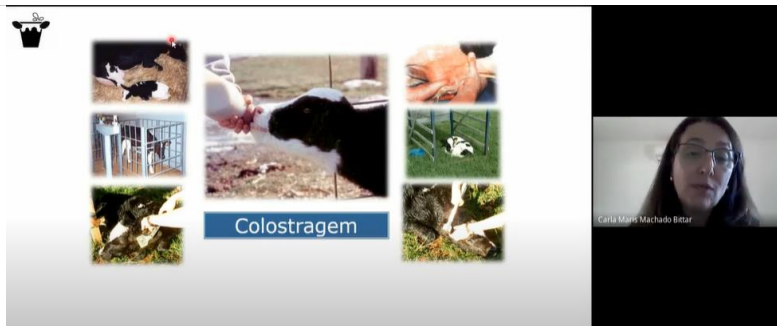
Figura 1. Print de aula sobre colostragem durante o curso de extensão à distância.

11. Projetos/Atividades de Extensão criados em 2020/2021 que estão em andamento (título, resumo, local de atuação/instituição, período).