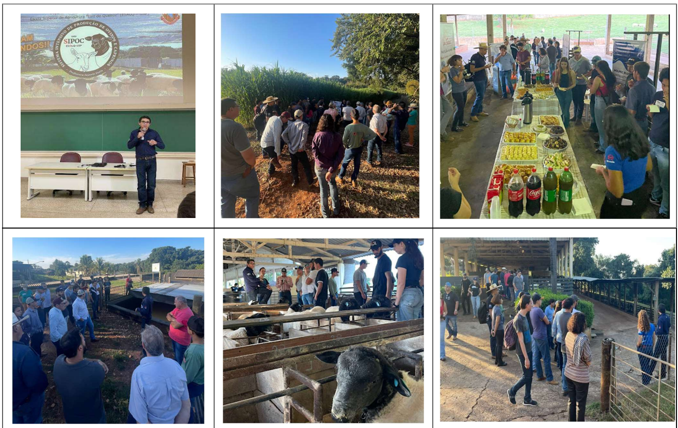
Figura 1: Registro do dia de campo durante a realização da "2ª Semana da Ovinocultura", ocorrido nas instalações do Departamento de Zootecnia, no setor de produção de ovinos e caprinos – SIPOC - ESALQ/USP

Destacamos também a realização de um dia de campo nas instalações do setor de produção de ovinos e caprinos - SIPOC - ESALQ/USP. O evento atraiu a participação de estudantes, produtores e técnicos interessados no aprimoramento de seus conhecimentos sobre a produção de ovinos. Para acessar mais detalhes e conteúdos relacionados ao evento, garantimos a disponibilidade do link: https://www.instagram.com/p/Csuh2HCu9KU/ .