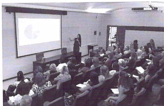
Apresentação dos resultados da pesquisa