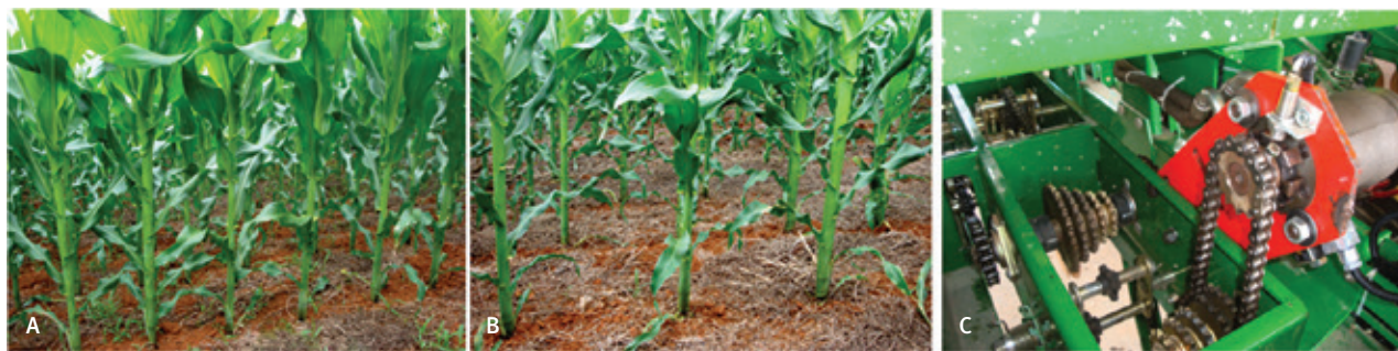
FIGURA 2 | POPULAÇÃO DE PLANTAS DE MILHO CULTIVADAS EM TAXAS VARIÁVEIS (A; B); MECANISMO DOSADOR HIDRÁULICO QUE SUBSTITUI ACIONAMENTO POR RODA DE TERRA (C)