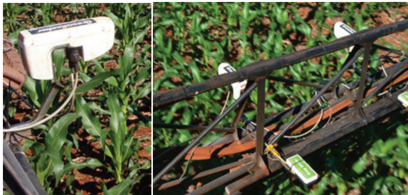
FIGURA 1 | MODELOS DE SENSORES ÓPTICOS EMBARCADOS, UTILIZADOS EM PESQUISA PARA AVALIAR ÍNDICES DE VEGETAÇÃO NA CULTURA DO MILHO

Em ambientes menos favoráveis à obtenção de altos rendimentos, a redução na população de plantas proporcionou ganhos de até 1.900 kg ha -1 , comparativamente à população padrão de milho (70.000 plantas ha -1 ), praticada nas