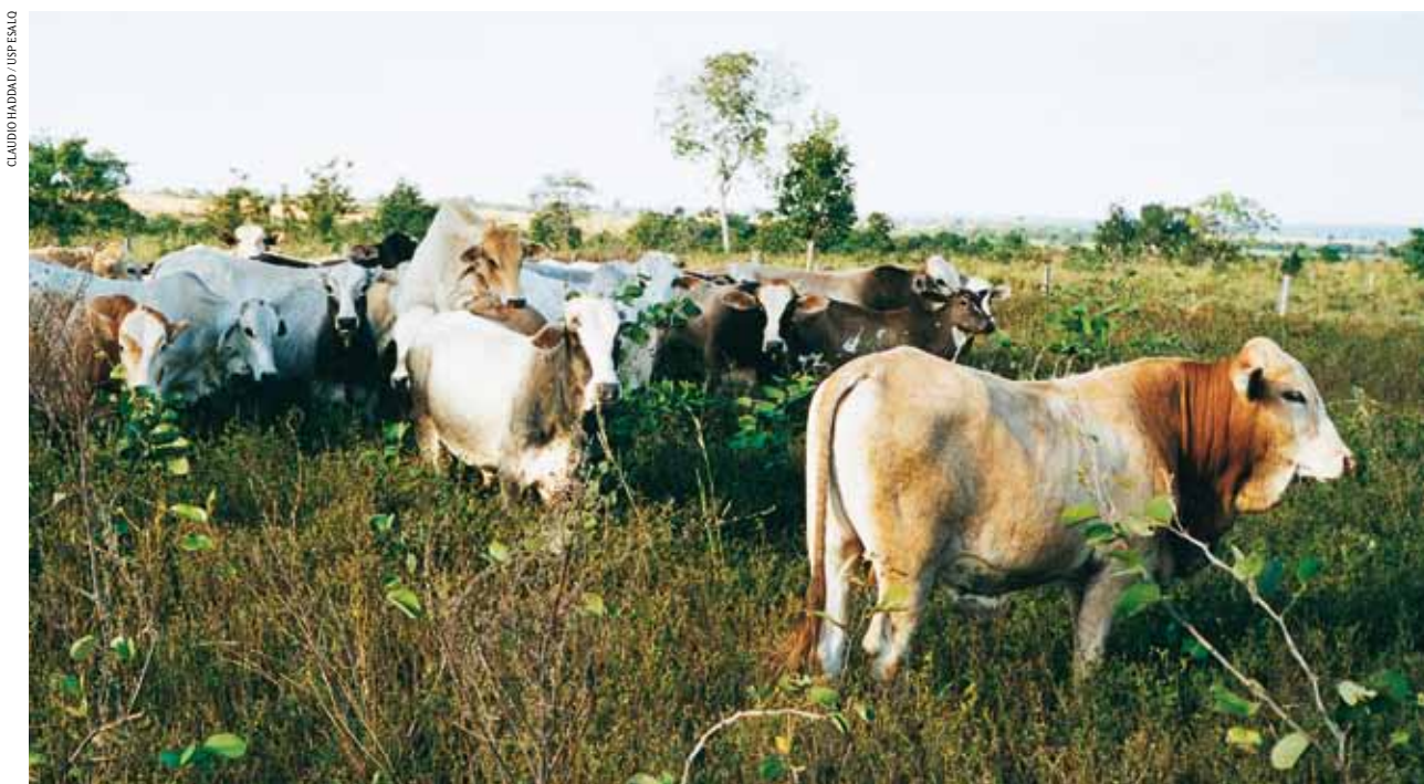
Garrotes de cruzamento industrial, Fazenda Saçarana, Mozarlândia, GO