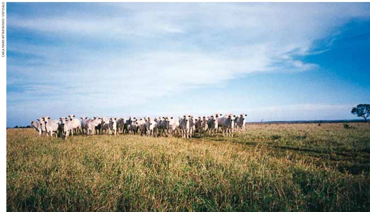
CARLA MARE BITTAR NUSSIO / USP ESALQ

O agronegócio da carne bovina cresce no Brasil a cada ano, ao mesmo tempo em que se estrutura de forma competitiva. No período de 1995 a 2003, segundo dados do Anualpec (2004), o crescimento da produção foi de 12,7%, enquanto o aumento das exportações foi superior a