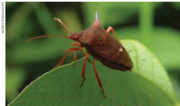
FIGURA 3 | PERCEVEJO EUSCHISTUS HEROS