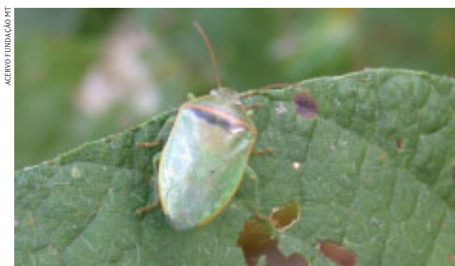
FIGURA 1 | PERCEVEJO PIEZODORUS GUILDINII