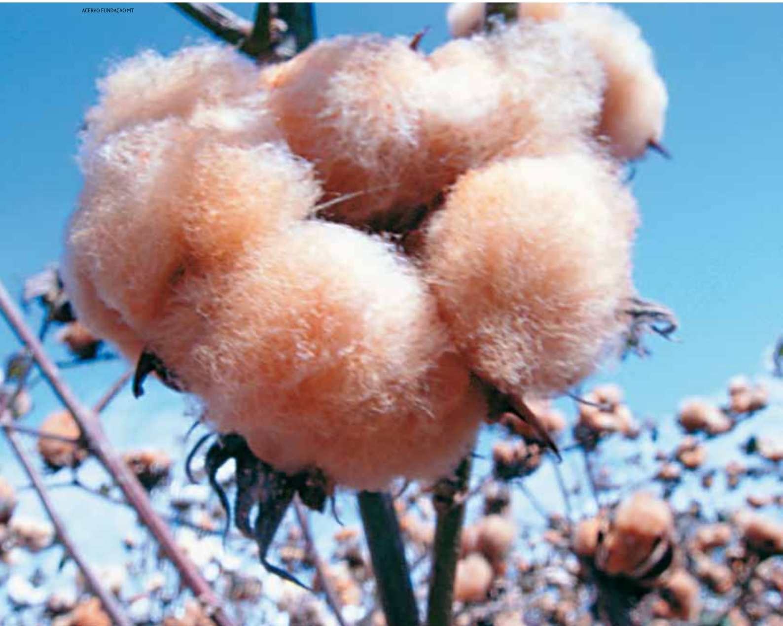
Algodão naturalmente colorido