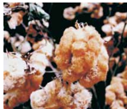
FIGURA 1 | CULTIVAR BRS RUBI

No Brasil, o algodão colorido é produzido exclusivamente na Região Nordeste. Existe uma cooperativa com várias associadas que fabricam roupas e outros artigos para venda no Brasil e exterior. São ao todo 70 franqueados. Outras pequenas empresas utilizam o algodão colorido