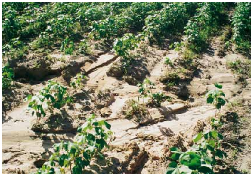
FIGURA 1 | DISPERSÃO DO NEMATÓIDE DAS GALHAS CAUSADA POR FORTE ENXURRADA

O manejo de todas as espécies de nematóides do algodoeiro baseia-se na aplicação de três técnicas principais: a rotação ou sucessão com culturas resistentes, o uso de cultivares de algodoeiro resistentes ou tolerantes e o uso de nematicidas. Alqueive e incorporação de matéria orgânica são práticas de menor efetividade, mas que também têm valor em complementaridade às técnicas principais. No caso do nematóide das lesões, informações mais recentes mostram que a adoção de medidas visando à sua redução populacional não se justifica. Em áreas de plantio no sequeiro, seus níveis populacionais são normalmente insuficientes para causar perdas significativas. Em áreas de plantio irrigado, situação que favorece muito o Pratylenchus brachyurus , dificuldades técnicas (como a quase ausência de culturas resistentes e a ausência de cultivares de algodão resistentes) e econômicas (o alto custo dos nematicidas em comparação com o provável aumento da produção) são, por enquanto, incontornáveis.