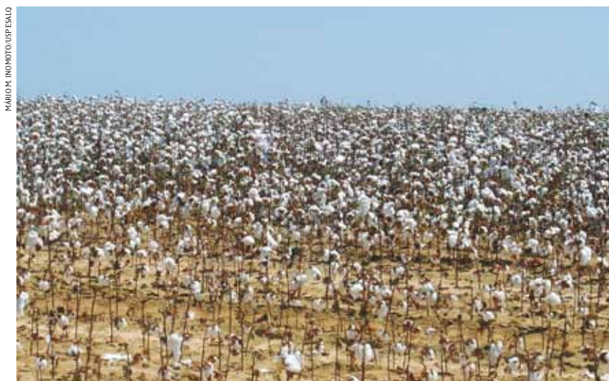
FIGURA 2 | PERDAS CAUSADAS PELO NEMATÓIDE DAS GALHAS: AO FUNDO, PLANTAS NORMAIS; À FRENTE, PLANTAS POUCO DESENVOLVIDAS