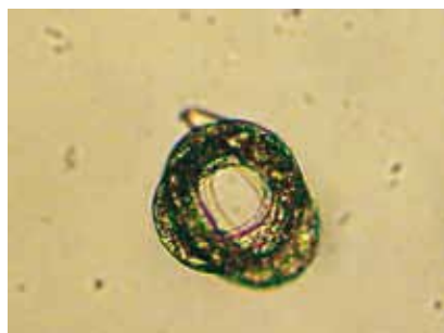
FIGURA 3 | NEMATÓIDE RENIFORME QUE SOBREVIVE EM ESTADO DE ANIDROBIOSE NA AUSÊNCIA DE HOSPEDEIRO E NA ESCASSEZ DE ÁGUA NO SOLO