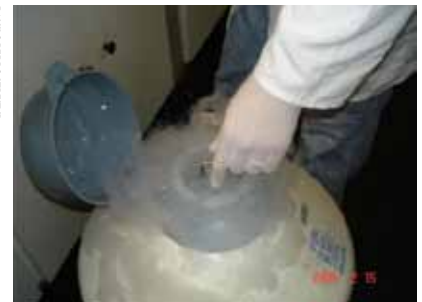
FIGURA 4 | BOTIJÃO DE ESTOCAGEM DE SÊMEN CRIOPRESERVADO A -196 °C EM NITROGÊNIO LÍQUIDO; DUKE ENERGY, SALTO GRANDE, SP, 2005