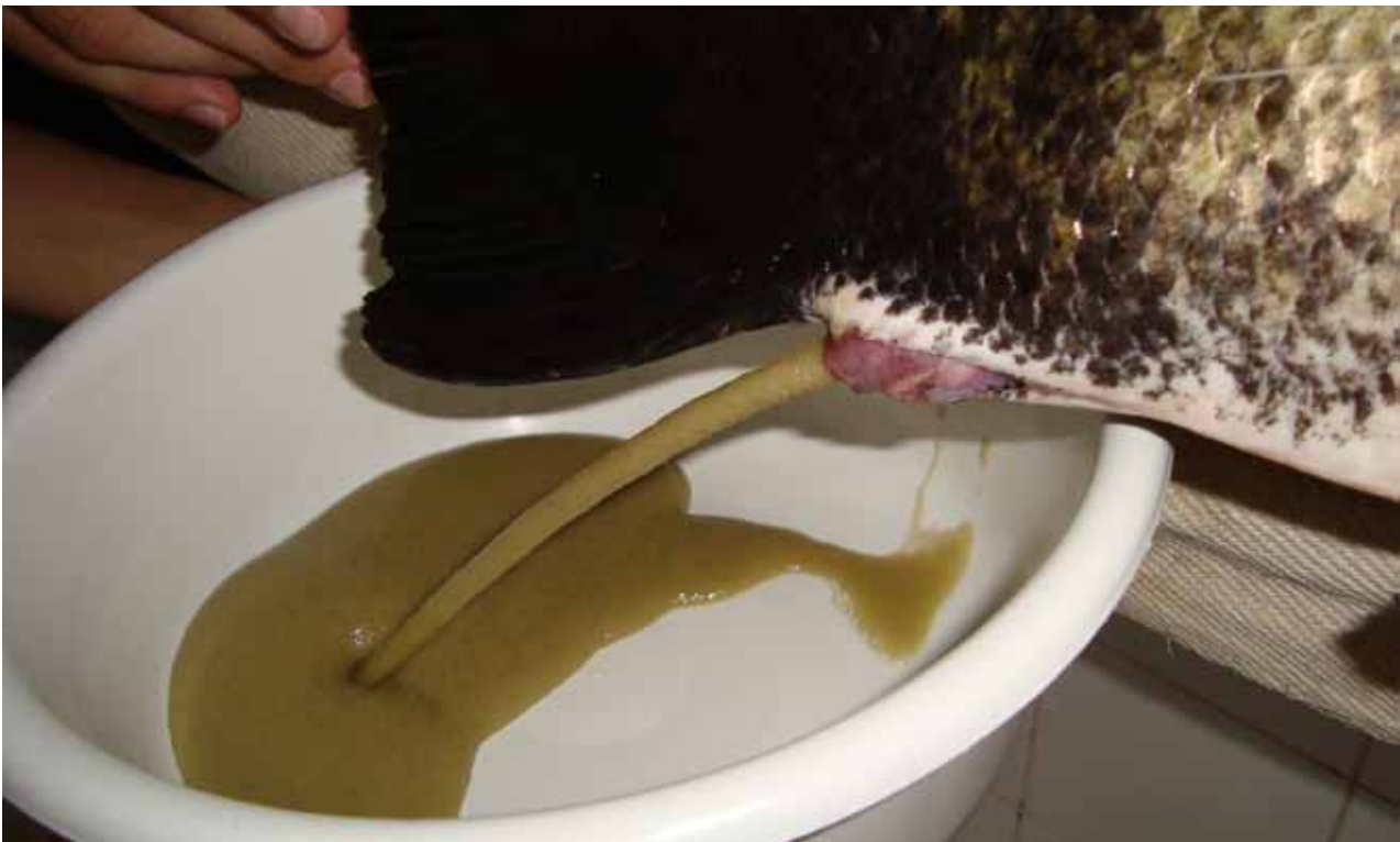
FIGURA 1 | EXTRUSÃO DE FÊMEA TAMBAQUI COM BOA FLUIDEZ, COLORAÇÃO E BRILHO DE OÓCITOS; PISCICULTURA BOA ESPERANÇA, PIMENTA BUENO, RO, 2012

técnica e posterior produção em massa, especialmente às espécies: tambaqui ( Collossoma macropomum ); pacu ( Piaractus mesopotamicus ) e curimba ( Prochilodus lineatus ). Ao longo das duas décadas seguintes houve pouca evolução quanto ao manejo de gametas e embriões das espécies nativas, inclusive não sendo desenvolvidas metodologias que considerassem a diferença de comportamento reprodutivo da carpa comum com as espécies sul-americanas de piracema.