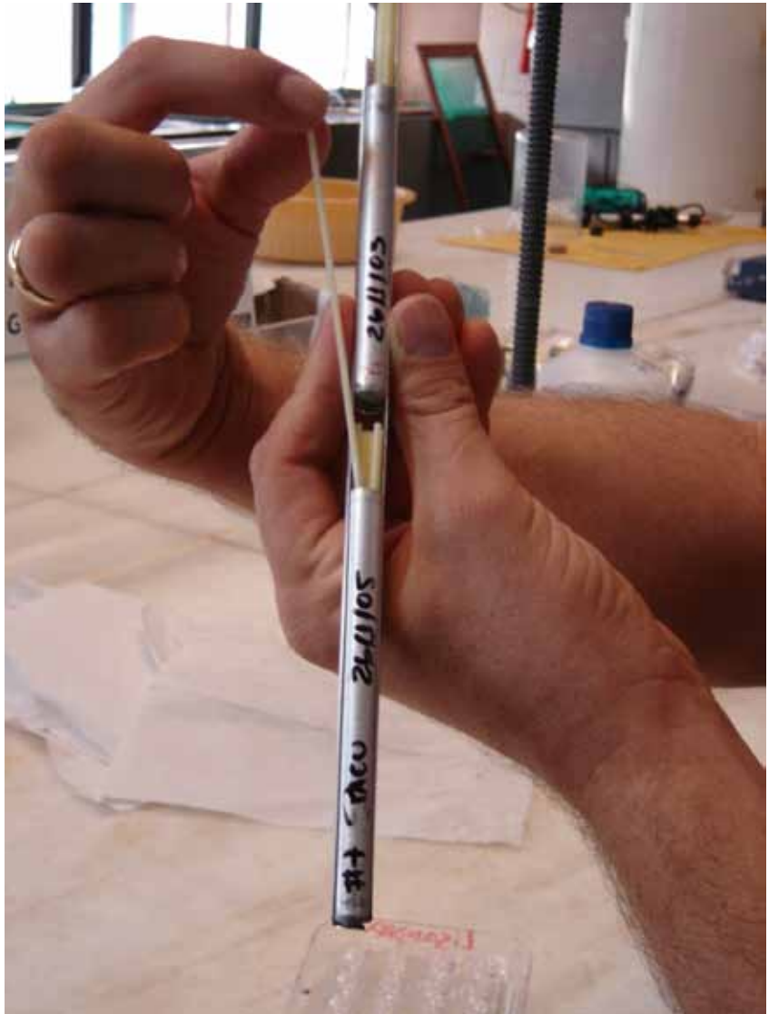
FIGURA 2 | PAILLETES DE 0,25 ML SENDO ENVASADOS COM SÊMEN + SOLUÇÃO CRIOPROTETORA À BASE DE GEMA DE OVO E GLICOSE E DMSO, COMO CRIOPROTETOR; DUKE ENERGY, SALTO GRANDE, SP, 2005

A qualidade dos gametas é fundamental para o desenvolvimento das técnicas in vitro . Pesquisas têm relatado que o estresse sofrido pelos reprodutores durante o manejo para a liberação dos gametas afeta sua qualidade, especialmente as fêmeas. Em um estudo recente com tambaquis, foi possível constatar que a boa qualidade do gameta feminino (oócitos) (Figura 1) é crucial para a fertilização, relegando a um segundo plano a importância dos espermatozoides.