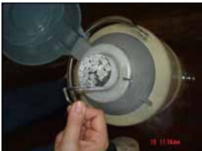
FIGURA 3 | BOCA DE UM BOTIJÃO TIPO DRY SHIPPER COM RACKS ALOCADAS EM UM ÚNICO CANECO PARA O RESFRIAMENTO DO SÊMEN, CARACTERIZANDO A PRÉ-CRIOPRESERVAÇÃO; DUKE ENERGY, SALTO GRANDE, SP, 2005